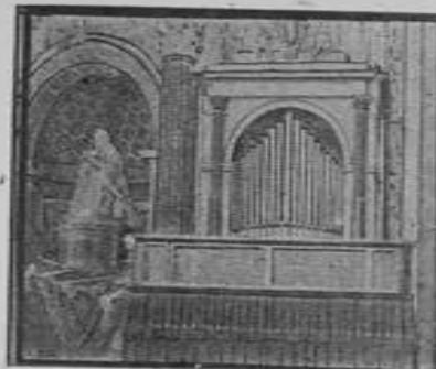
Basilica de Sn. Pedro, Roma. Organo Walcker.

HIMNO GUADALUPANO, AVE MARIA Y WESTMINSTER Dist. Excl. MEXICO WATCH Co. S. A. Artículo 123 No. 32 México, D. F.