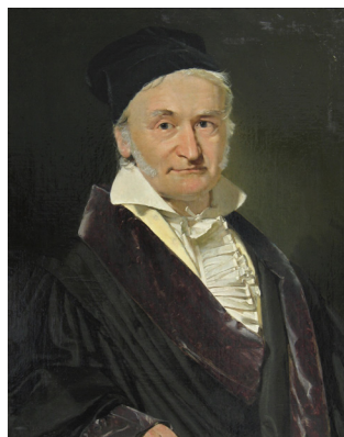
Karl Friedrich Gauss (1777-1855).

Entre los que obtuvieron 14 votos estaban. Karl Friedrich Gauss (1777-1855), Hans Christian Oersted (1777-1851), Louis Agassiz (1807-1873) y Pierre Flourens (1794-1867).