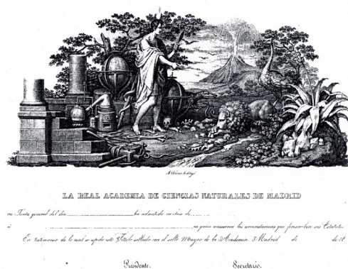
Diploma de la Real Academia de Ciencias Naturales de Madrid.

El formato de esta celebración me impide dar cuenta aquí de los diversos intentos de mecenazgo real en los dos siglos siguientes hacia instituciones científicas que desgraciadamente no lograron concretarse en nada perdurable, pese a la relevancia de muy notables singularidades como Jorge Juan (1713-1773). Sin embargo, es importante mencionar una iniciativa que se plasmaría como la antecesora directa de la actual Real Academia de Ciencias y que tuvo una vida activa durante una decena de años: me refiero a la denominada Real Academia de Ciencias Naturales de Madrid, creada en 1834, por la Reina Regente, a propuesta del Gobierno de Martínez de la Rosa (1787-1862).