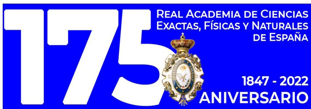
Logotipo de la celebración de 175 aniversario de la Real Academia de Ciencias.

La notoriedad y novedad de esa lista de los primeros Académicos Correspondientes Extranjeros, muestra algo que no siempre ha sido resaltado suficientemente: las fluidas relaciones de la sociedad científica española de la época con el extranjero. Indagando en los archivos de esta Academia tuve la suerte de encontrar, trasapelado en un legajo conteniendo la información sobre este edificio, un gran sobre conteniendo las cartas de aceptación y agradecimiento de aquellos Correspondientes Extranjeros iniciales.