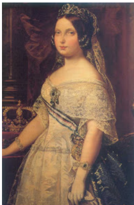
Isabel II (1830-1904).

El 25 de febrero de 1847, se publicaba el Real Decreto de creación de la Real Academia de Ciencias Exactas, Físicas y Naturales, sancionado por la Reina Isabel II (1830-1904), a sus 17 años: hacía tan solo cuatro que había accedido al trono tras la primera regencia de su madre, María Cristina de Borbón (1806-1878), de 1833 a 1840, y la del General Espartero (1793-1879), de 1840 a 1843.