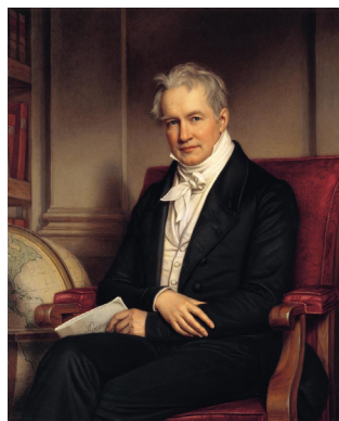
Alexander von Humboldt (1769- 1859).

En 1848 se decidió nombrar tan sólo dos terceras partes de los 36 fijados por los Estatutos. Una selección del resultado final es la siguiente: obtuvieron 15 votos (sobre 15 posibles) Alexander von Humboldt (1769- 1859), Michael Faraday (1791-1867) y Robert Brown (1773-1858).