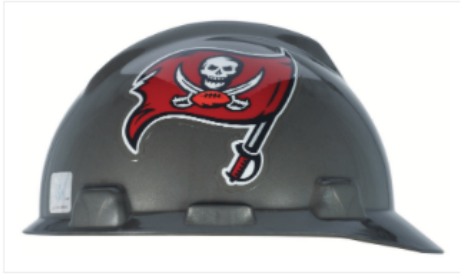
818412NFL Tampa Bay Buccaneers