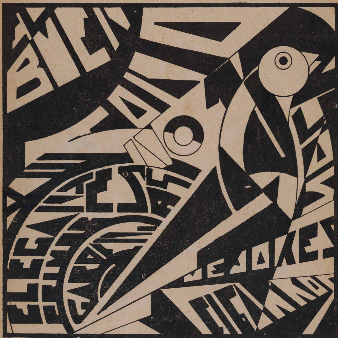
IRRADIADOR NO. 1, Back Cover