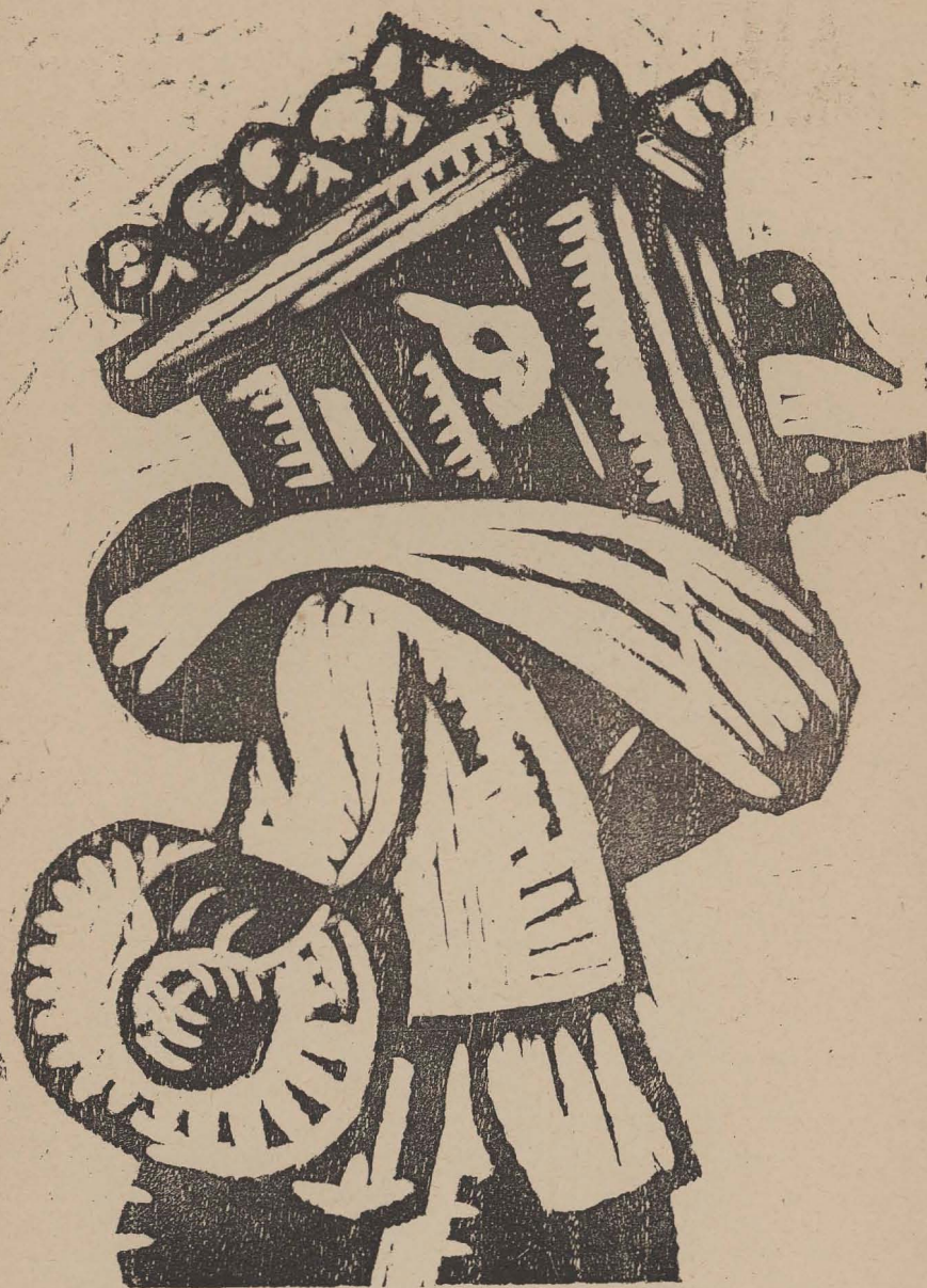
RABADO EN MADERA E JEAN CHARLOT