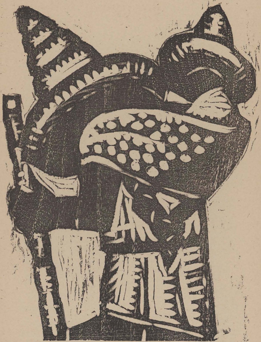
GRABADO EN MADERA DE JEAN CHARLOT