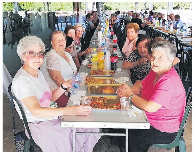
Els majors també van disfrutar d'un animat esmorzar popular de germanor.

van tindre especial protagonisme els integrants de la penya l'Espenta, encarregats de portar a coll el pas del sant.