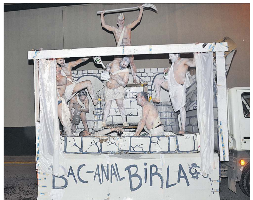
Los peñistas protagonizaron el desfile de disfraces y, tanto a pie como en carroza, con la representación de bailes y 'skechs' hicieron las delicias de un público que les premió con aplausos durante el recorrido.