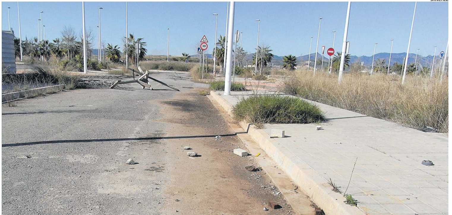
La finalización del desarrollo urbanístico del PAI Belcaire Sur precisa una gran aportación económica a la que tendrá que hacer frente el Ayuntamiento.

El alcalde, Wenceslao Alós, ha reiterado que es la única medida posible para equilibrar unas cuentas municipales que, además de las dificultades descritas, va a ver mermados sus ingresos por la liberalización de la autopista en 102.231,98 euros.