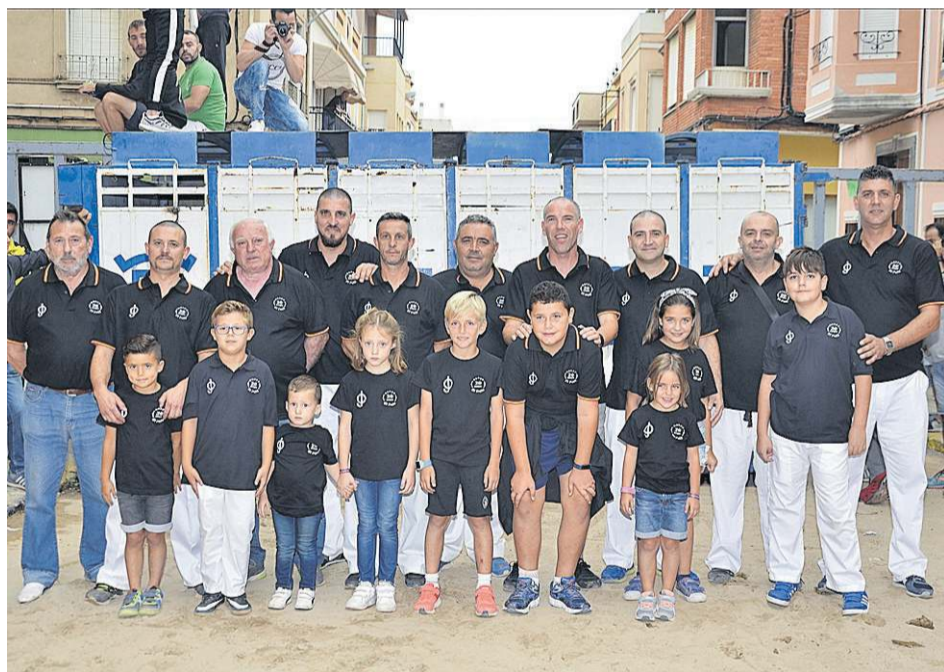
La peña El Peló cumple este año un cuarto de siglo y celebró a lo grande su 25º aniversario.