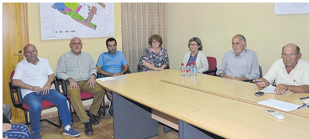
Miembros de la junta de la Cooperativa de Riegos y el Sindicato de Riegos local, durante una reunión reciente.

La Cooperativa de Riegos Moncofa y el Sindicato de Riegos de la localidad celebraron una asamblea general extraordinaria en la que trataron diversos temas importantes.