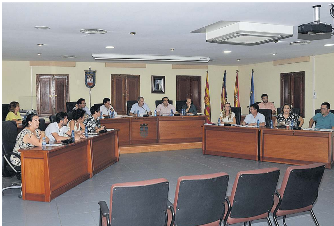
La corporación municipal ha tratado este asunto que implica el tener que sacar un préstamo para hacer frente al pago.