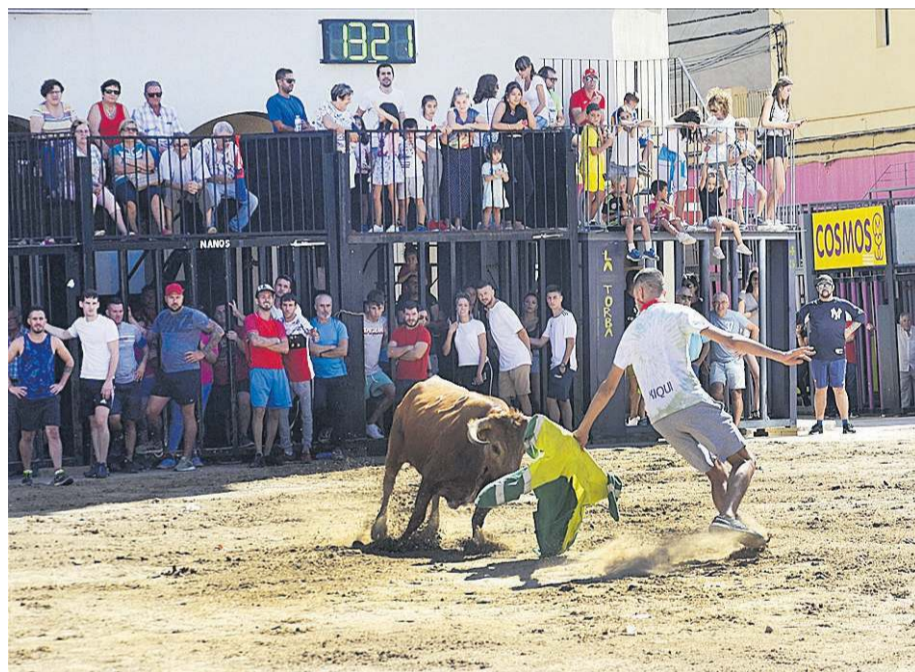
Las exhibiciones de vaquillas, en el coso de Moncofa, fueron una cita obligatoria..