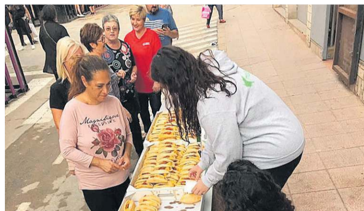
El almuerzo con el tradicional 'cafenet' es un clásico irrenunciable.