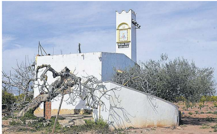
Imatge d'un dels pous existents al municipi, que va ser construït a l'any 1946.

Tot el terme municipal estava ple de motors, que es trobaven dins de partides Bobalar Nou. (motor de la Micaleta, Magdalena, Momplet, Alós, Pedro); Tarancón (motor de Tarancón, Alfredo, Medem, Sant Josep, Barranquet, (Cabiello 2 Bobalar), Casablanca