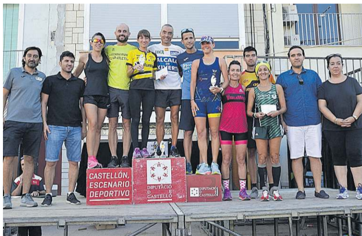
Las autoridades acompañaron a los ganadores durante la entrega de premios.