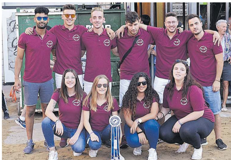
Els integrants de les penyes l'Asgarró i l'Asguitó, responsables de la comissió.