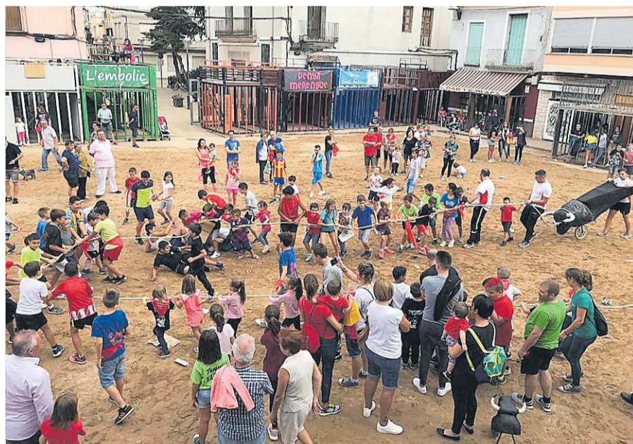
Los más pequeños disfrutaron de una tarde agradable con el baile, los juegos y los disfraces.