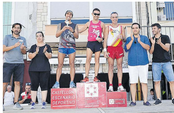
Tres grandes atletas se subieron al podio, en la categoría local masculina.