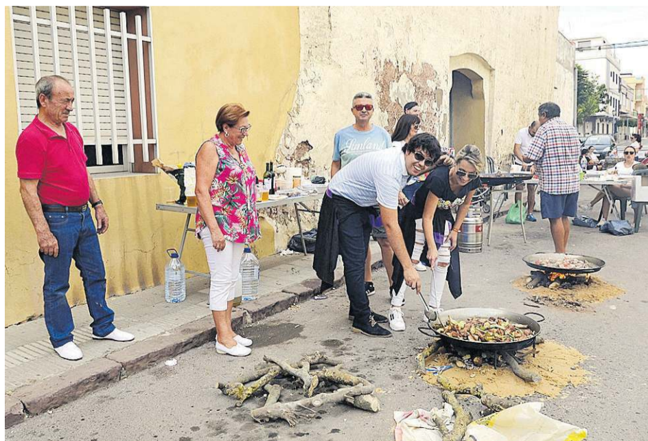
El 'dinar de paelles', que se celebró en la calle San Pascual, se convirtió en el epicentro festivo.