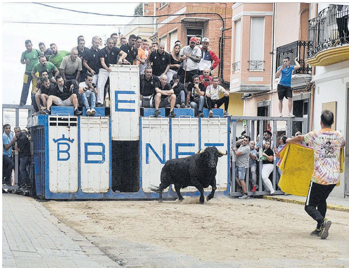
El toro que aportó la peña El Peló satisfizo a los aficionados desde el mismo instante de la descajonada.