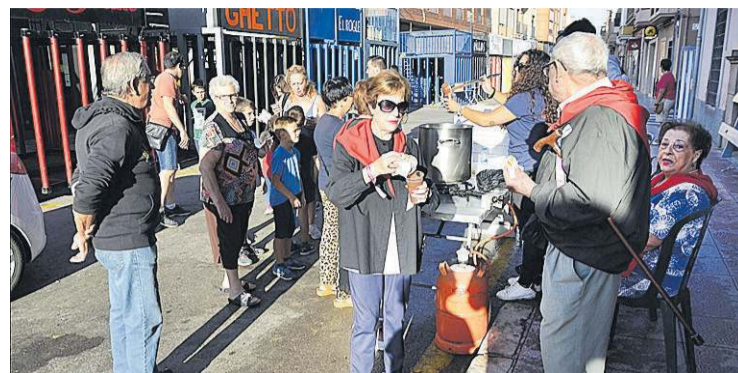
Los vecinos acudieron a degustar el chocolate caliente con ensaimadas.