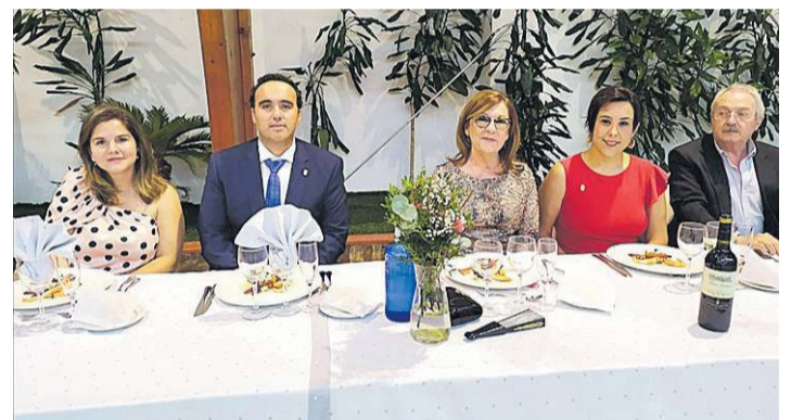
LA ASOCIACIÓN DE JUBILADOS Y PENSIONISTAS DISFRUTA DE SU COMIDA ANUAL

El Grup de Danses Biniesma ha llevado a cabo un intercambio con el Grup de Danses Arenilla de Borriana y disfrutaron juntos de los bailes populares.