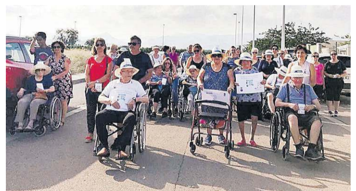
MONCOFA CELEBRA EL DÍA DEL ALZHEIMER CON LOS INGRESADOS EN SAVIA

para llevar a cabo este llamamiento, que congregó a un buen número de vecinos. Un grupo de mujeres y niños, leyeron un manifiesto en defensa de la mujer.