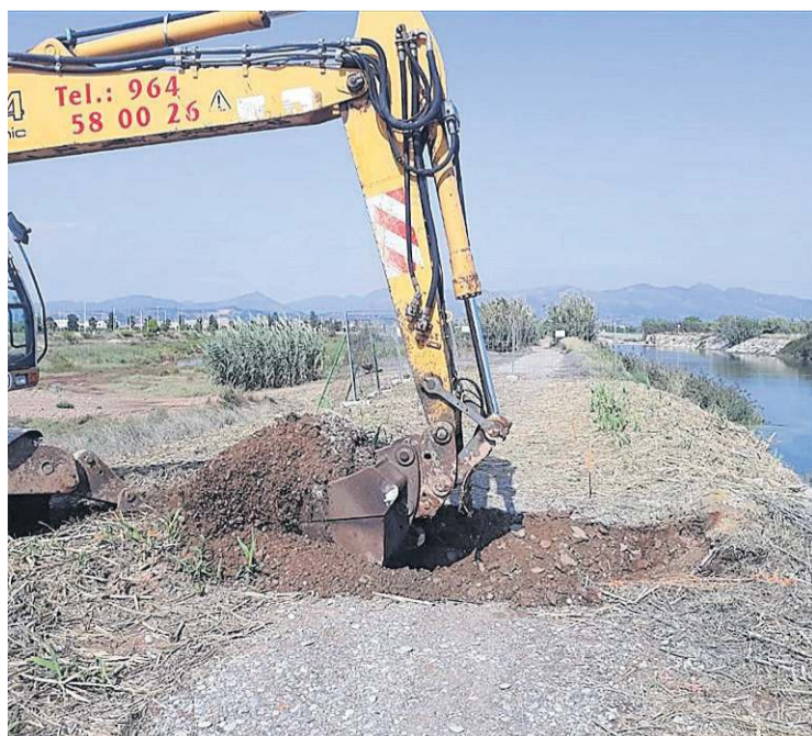
Actualmente los trabajos se centran en la construcción de los pivotes.

Este fet ha demostrat que el nostre poble, la nostra gent, unida, pot aconseguir molt, tot el que es proposa. El que va succeir fa que hem reafirme en les paraules que vos vaig expressar en el discurs del Dia de la Comunitat Valenciana «a pesar de totes les dificultats tinc, confiança en la millor riquesa del nostre poble, la seua gent. El nostre futur sols depèn d'una cosa, de nosaltres. Aprofitem l'oportunitat. Moltes gràcies a tots».