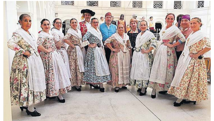
EL GRUP DE DANSES BINIESMA PARTICIPA EN UN INTERCAMBIO CULTURAL

El Grup de Danses Biniesma ha llevado a cabo un intercambio con el Grup de Danses Arenilla de Borriana y disfrutaron juntos de los bailes populares.