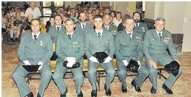
La homilía reunió a la corporación, las representantes festivas y los agentes..