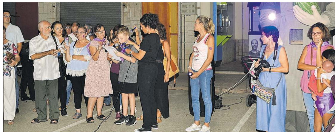
MONCOFA CONGREGA A NUMEROSOS VECINOS CON MOTIVO DE LA NIT VIOLETA

Los jubilados y pensionistas de la asociación Belcaire disfrutaron de su tradicional comida anual, que supone la ocasión perfecta para el reencuentro.