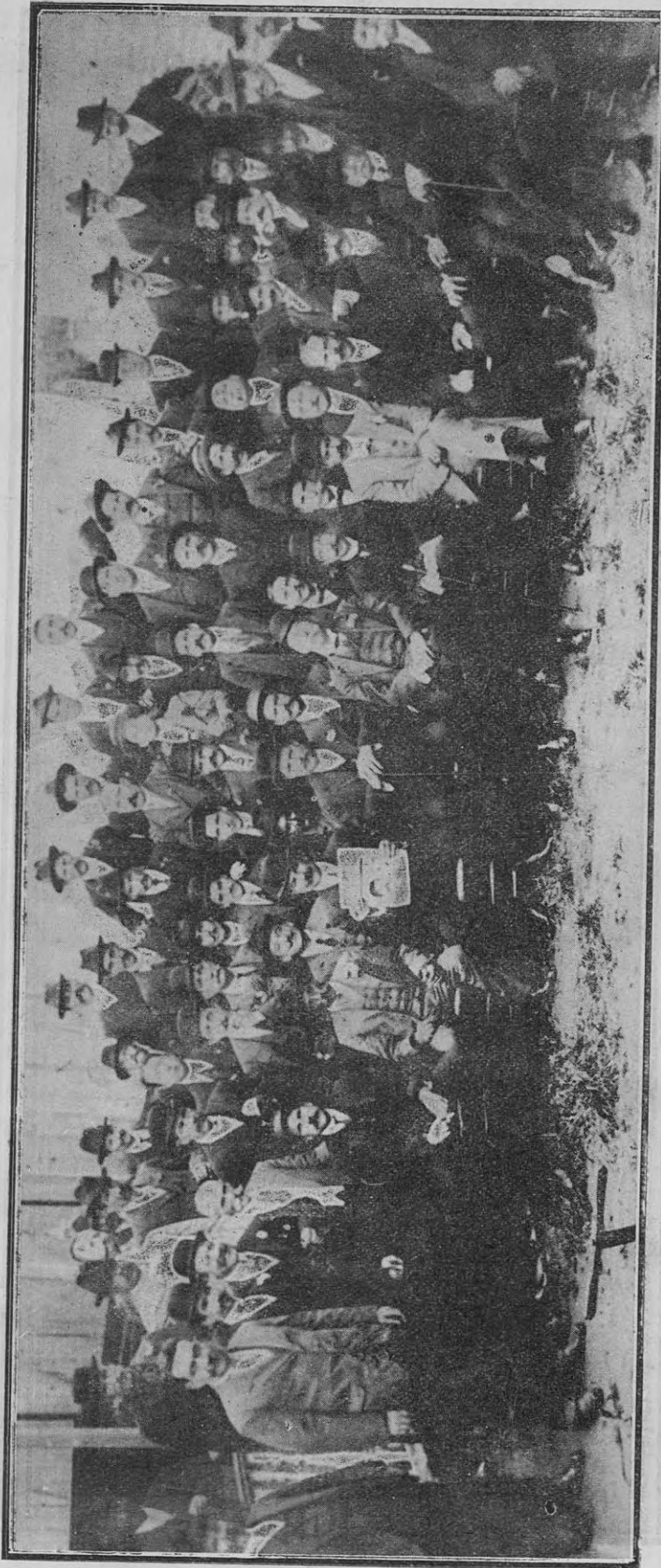
Después del almuerzo