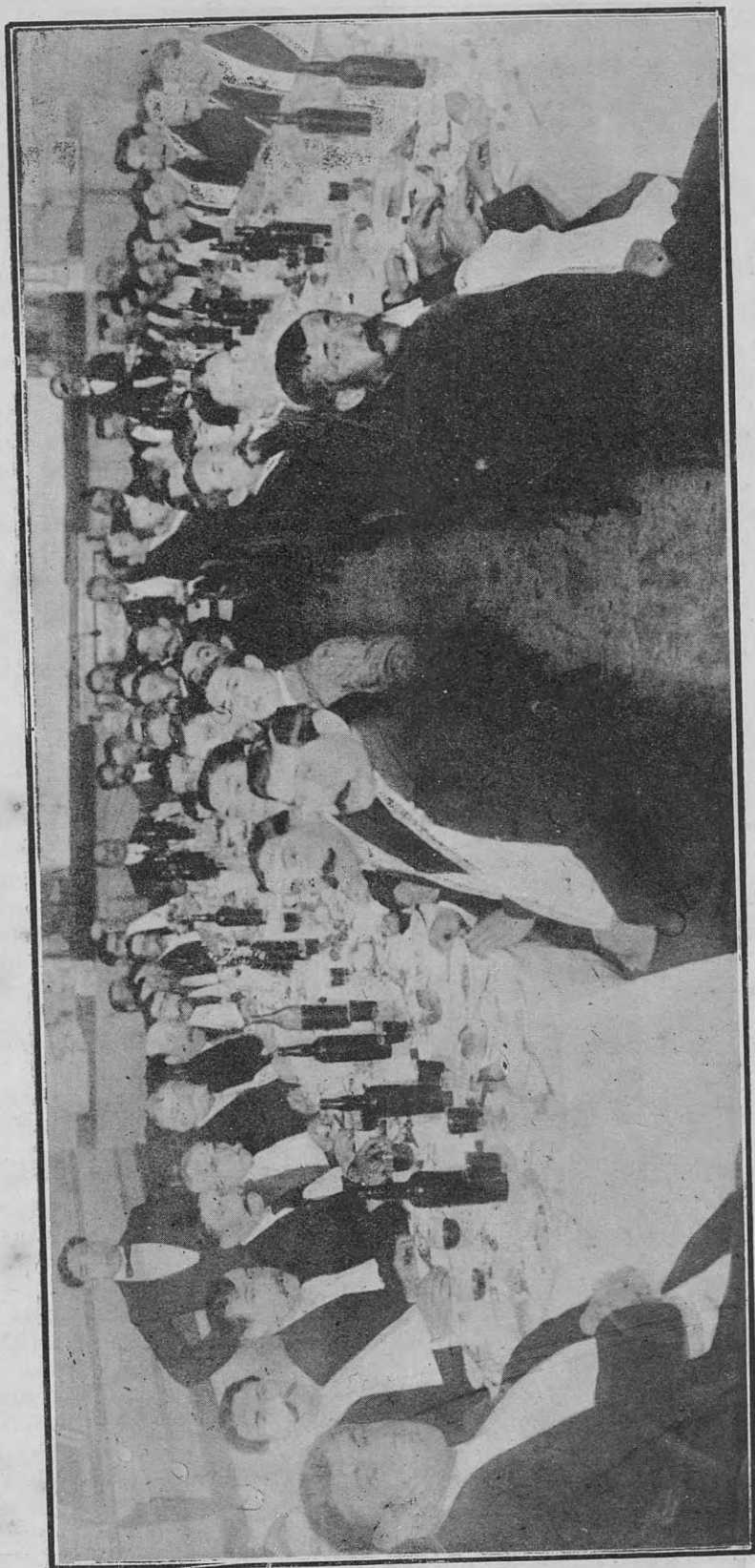
CENTRO GALLEGO: Banquete en los salones de la sociedad con motivo de su aniversario