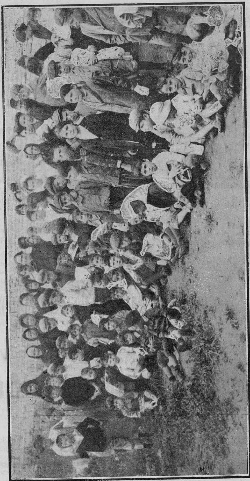
Niños pobres á quienes el Centro Gallego regaló ropa