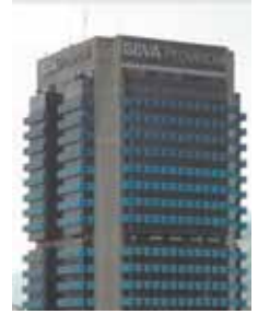
BBVA prevé una tasa de Bs. 430 por dólar.

BBVA usará una estimación de inflación de su servicio de estudios (el 170%) y ha estimado un tipo de cambio de 469 bolívares por euro (unos 430