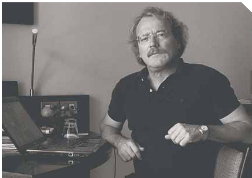
Alberto Barrera Tyszka no avizora el fin del chavismo cerca. “Como movimiento político tiene una identidad más clara, más definida frente al país, que esa experiencia heterogénea que llamamos oposición”, explica.

—Yo creo que Maduro existe para proteger la posteridad de Chávez. Y quizás para eso fue elegido. Para proteger a Chávez de Chávez. Para que la obra de Chávez no arruine el culto a Chávez. Para sacrificarse y quedar, ante la historia, como el responsable de un desastre que —en rigor— no le pertenece del todo. El destino de Maduro es ingrato. Ahora pareciera que todas las narrativas del país, incluso la suya propia, apuntan hacia la misma dirección. La salida de Maduro del poder parece la nueva ficción nacional.