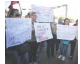
Mañana el Ministerio presentará su propuesta salarial.