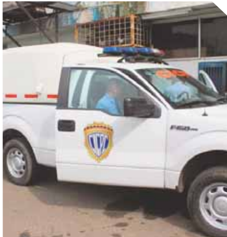
Los cuerpos los trasladaron a la morgue de Cabimas.

Dos sujetos llegaron en un taxi, un Chevrolet Aveo, blan-