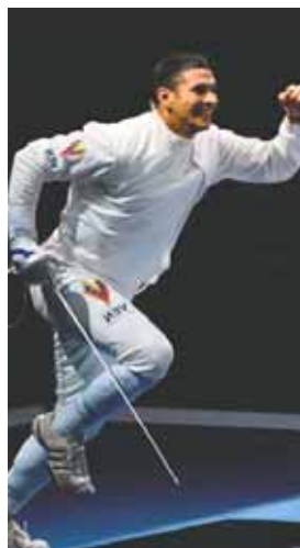
Rubén Limardo sigue despuntando en la esgrima internacional.

Aseguró que está a disposición del conjunto para formar parte del staff de coaches para la justa "El único sueño que me queda por cumplir es ponerme la 'V' de Vinotinto. De haber sido Oswaldo (Guillén, el mánager) sé que tenía un buen chance, de igual manera, estoy a disposición", cerró.