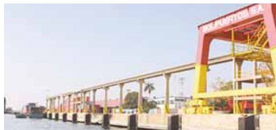
Cada día es menor la movilización de buques en el puerto de Maracaibo

porque no han llegado barcos en los últimos días. La situación va de mal en peor". Informó que hicieron una reunión de emergencia entre graneleros y transporte pesado para evaluar las perspectivas en los próximos días, pero llegaron a "conclusiones desalentadoras porque no hay importaciones".