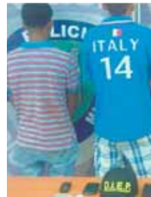
Miembros de la banda están reclusos en El Marite.