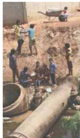
Los habitantes del barrio Ciudad Lossada se bañan a orillas de la cañada, pues el agua no les llega.

El llamado de Vanessa Valencia fue claro. “Si no solucionan habrá más enfermedades”. Muchas de estas personas que hacen largas colas y se bañan a la orilla de la cañada, no cuentan si quiera con un envase para llevarse a su casa. Hay un baño público en plena Circunvalación 2.