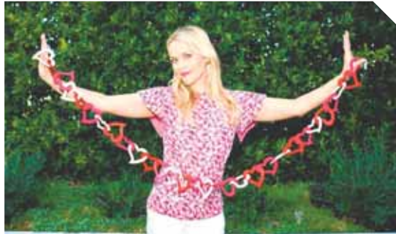
La hermosa Reese Witherspoon, sin mostrar con quién la pasó, disfrutó el día haciendo corazones de papel.

► Redacción Vivir | redaccion@versionfinal.com.ve