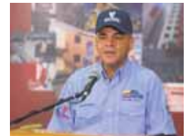
Ministro para la Vivienda, Manuel Quevedo.