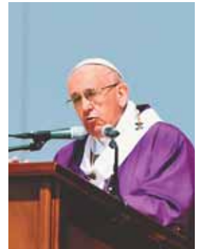
Las palabras de Francisco, en México, han sido muy contundentes.

El pontífice llegó en helicóptero al Centro de Estudios Superiores de Ecatepec, donde abordó el papamóvil para recorrer el campo saludando a un mar de fieles que lo aguardaban con júbilo.