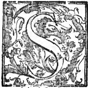
a Iudæo & Gentili b Pro habenda iustitia. c Idest ex debito omnia legalia debet implere, quod exigit circūcisio. Vt enim baptisimus suam, sic circūcisio suam exigit iustificationem.

* Sedul. Qui caput operum legis, vel circūcisio suscipit, necesse est vt cetera membra sustineat, ne maledictioni subiaceat.