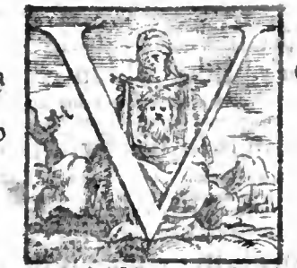
Vel consolationem accipiant.

a Volo enim. b Pro vo. Non enim minus pro his quos non vidit, quam pro his quos vidit sollicitus fuit. c Instru. in cha. Quia deus ad nos habuit, qui pro nobis filium tradidit. Hoc si quis attendit, potest se in hac miseria consolari, quia inde perpendit calcata superbia per humilitatem ad patriam posse reuerti. Et instru. in chari. * Ansel. Qui enim hoc attendit, potest se in hac miseria consolari, quia inde perpendit, ad patriam se posse reuerti. Qui hoc (inquam) attendit, potest se in aduersis, quae patitur, consolari, quia inde perpendit, quam iustum sit, vt ipse pro peccatis suis flagella patiatur, cum dei filius tanta sine peccato passus sit. Agnitio ne dei, per hoc tendentes.