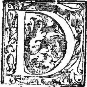
a Inflare dico.

D omi. quodiu. est & equum seruis præstate, scientes quoniam & vos dominum habetis in celo Orationi instate, vigilantes in eā in gratiarū actione.