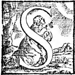
a Gaudis sum de fidei imp. etc. ut constanter patiamini.