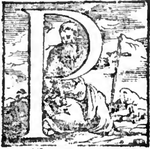
a Remissio peccatorum.

a Cuius officij tu particeps. perface ergo debetum officij opus. In hoc sis imitator.