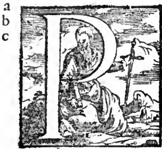
a Paulus inquam, &c.

A P Aulus Apostolus non ab hominibus neque per hominem, sed per Iesum Christum & Deum patrem, qui suscitauit eum