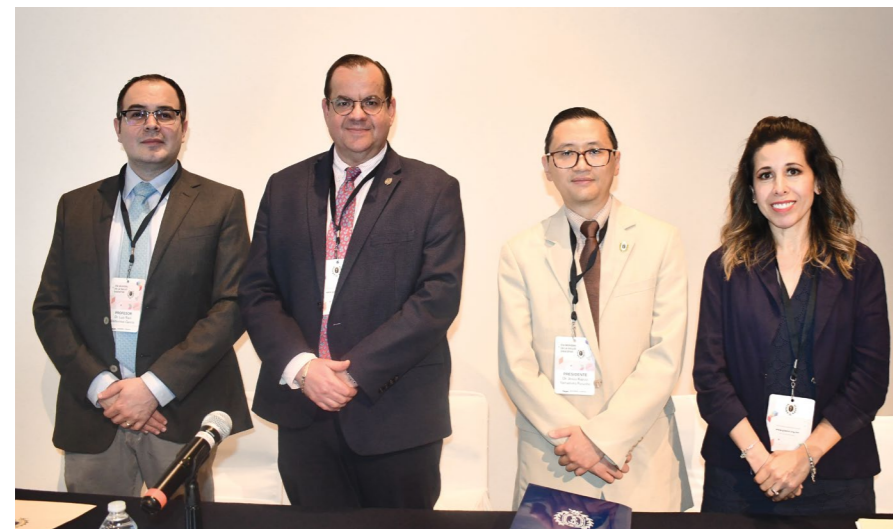
Integrantes de la Mesa Directiva AMG 2023.

“Durante el año como Vicepresidente se realiza la planeación de la siguiente Presidencia, con la designación de distintas sedes para las tres Reuniones Regionales, los diferentes eventos como el Curso ECOS Internacionales y la Semana Nacional de Gastroenterología. Todo esto incluye visitas de inspección a cada ciudad, diferentes hoteles y analizar el potencial logístico de cada evento y