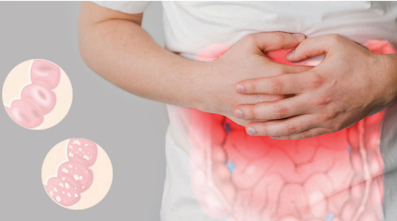
La enfermedad inflamatoria intestinal es uno de los principales padecimientos en la población mexicana.