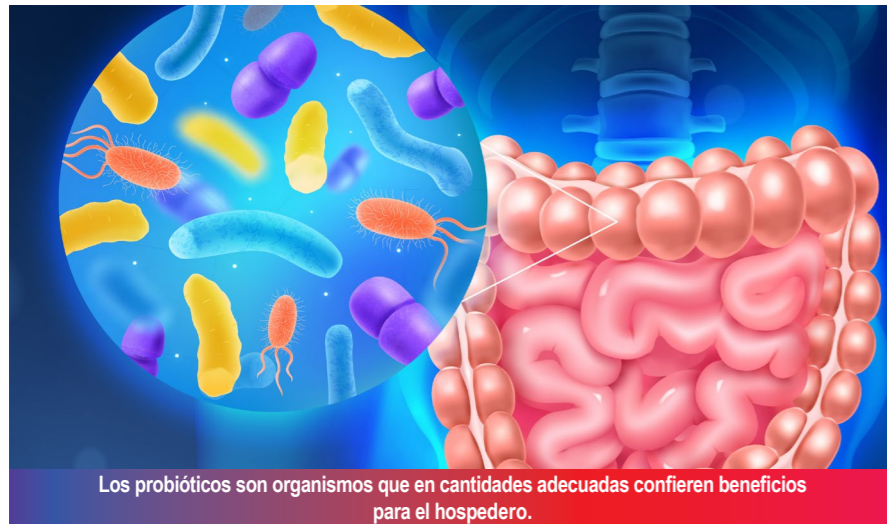
Los probióticos son organismos que en cantidades adecuadas confieren beneficios para el hospedero.

Mexicano de Gastroenterología, Secretario de Relaciones de la Asociación Mexicana de Neurogastroenterología y Motilidad, y miembro del Comité Internacional del American College of Gastroenterology.