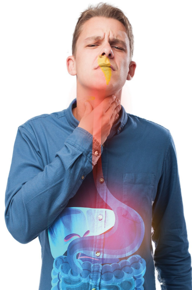
La disfagia orofaríngea incremento considerablemente después de la pandemia por COVID-19 (SARS-CoV-2).

conforme a la información y los eventos que necesitan apoyo para la participación de algunos ponentes, traslados, etcétera”.