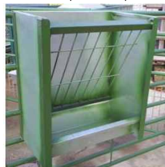
Comedero paridera opcional