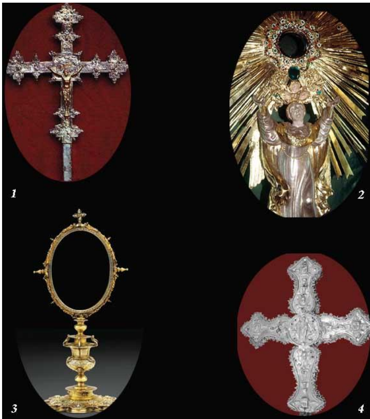
Ilustración 13: 1- Cruz procesional de Parroquia Santa Engracia (Pamplona, España), atribuida a Juan de Salazar. 2- Custodia de la Iglesia de Santo Domingo (Nueva Guatemala de la Asunción), confeccionada por Luis Arenas. 3- Relicario hecho por Pedro de Bozarráz (el Mozo) (1590). 4- Cruz procesional, parcialmente dorada al mercurio, confeccionada por Pedro de Bozarráz (el Mozo) en Santiago de Guatemala, entre 1580 y 1590. Colección privada.