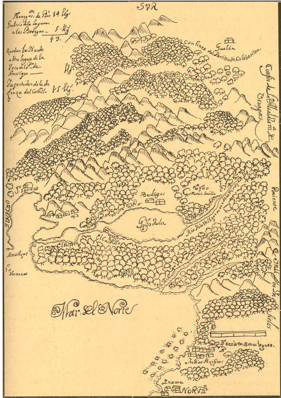
Ilustración 7: Alcaldía Mayor de Amatique (Izabal). Dibujo que aparece en la Recordación Florida , de Francisco Antonio de Fuentes y Guzmán.

y Cuba, respectivamente, Alonso Criado de Castilla, el último de los presidentes togados, trasladó Puerto Caballos a Amatique, donde inició la construcción del Puerto de Santo Tomás de Castilla; y sustituyó la tradicional ruta comercial (Santiago de Guatemala, Sierra de las Minas por la Ruta del Mico, Bodegas del Golfo, Lago de Izabal, Golfo Dulce, Puerto Caballos o Trujillo) por una terrestre.