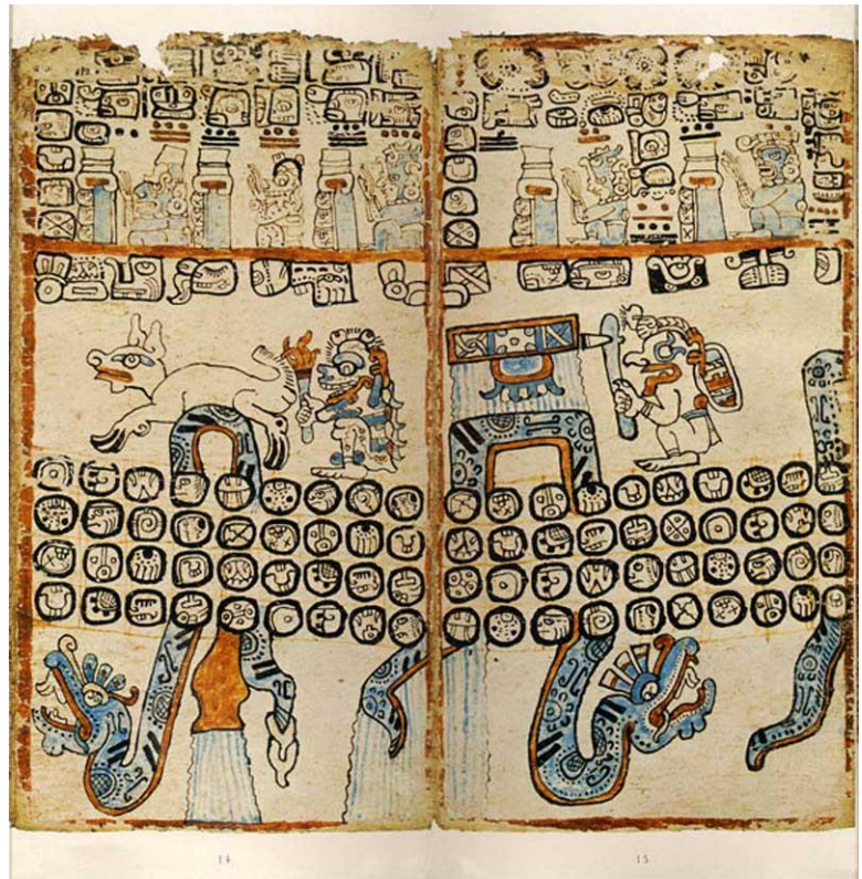
Ilustración 1: Láminas 14 y 15 del Códice de Madrid , en que aparecen Itzamná, Chac, Kukulcán, el Dios del Maíz, el Dios de la Muerte y el Dios del Comercio.

Los indígenas iniciaban la producción de tinta con el corte de ramas de jiquilite que, después de secarlas al sol, las colocaban en remojo en ollas o tinajones, en las que las batían con palas de madera durante varios días, para que se formara una lama azul y ésta se depositara en el fondo. Luego de sacar los restos de las ramas podridas y de botar el líquido, metían el lodo azul en sacos de pita de maguey que colgaban para que se escurriera. Al final, lo distribuían en guacales para su secado completo al sol. Los muralistas elaboraban el azul maya, combinando el polvo obtenido con una arcilla especial identificada como atapulgita , para darle durabilidad y resistencia a los solventes.