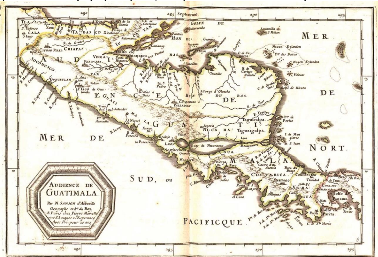
Ilustración 3: Audiencia de Guatemala (1657). Mapa de Nicolas Sanson d'Abbeville, Geógrafo del Rey.

alcanzó en tiempo que lo administró habrá 20 años tenía 80 tributarios, y que ahora sabe por cosa cierta no tiene más que nueve o diez; y el pueblo de Naolingó en la misma jurisdicción tendría por el tiempo dicho 200 indios tributarios poco más o menos, y al presente, según he oído decir, no tiene de 70 a 80; y que asimismo en la Provincia de San Salvador conoció y vio otros pueblos como Apastepeque, Cuscatán, Citepeque, que eran muy numerosos de indios, y que con ocasión de los obrajes que tienen muy cerca de ellos están ya muy acabados y menoscabados, porque entrando que entra la temporada enferman los más por el mucho trabajo que pasan por la fuerza y maleza de la tinta hierba de que se hace. 26