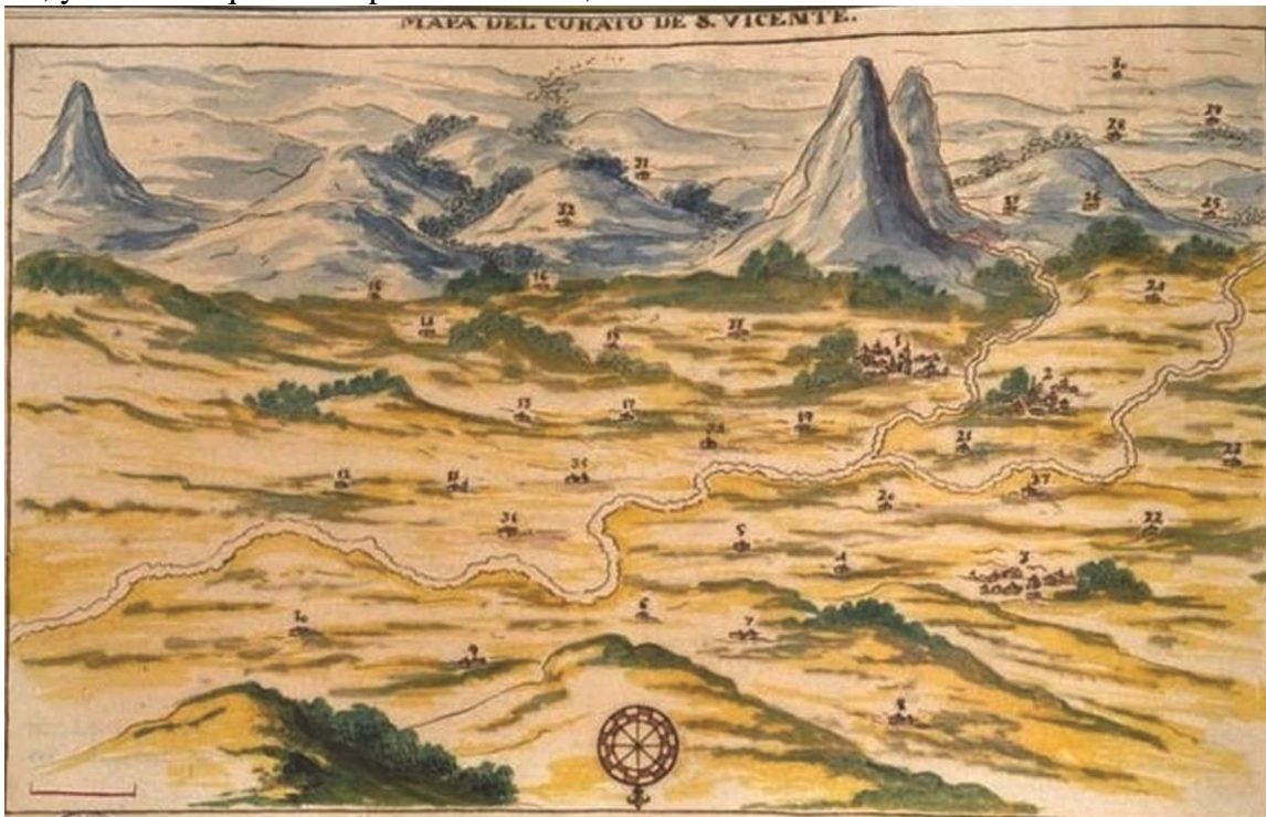
Ilustración 15: Mapa del Curato de San Vicente de Austria (El Salvador). Descripción Geográfico-Moral de la Diócesis de Guatemala , de Pedro Cortés y Larraz (c 1770).