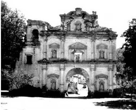
Ilustración 9: Fachada de Iglesia de Nuestra Señora de los Remedios (Antigua Guatemala, Sacatepéquez).

habitaciones, en la Calle de los Pasos, entre la Escuela de Cristo y el Templo de El Calvario. Por lo que queda de dicho templo, destruido por el Terremoto de Santa Marta, la fachada e interior del mismo ha de haber sido un variado conjunto plástico, en el que los paseantes de la Alameda de El Calvario podían recrearse y rememorar la vida de algunos santos. Muchos años después, entre 1679 y 1680, cuando el comercio del añil estaba en su cenit, el Capitán José Aguilar y Rebolledo mandó construir una Fuente en dicha Alameda.