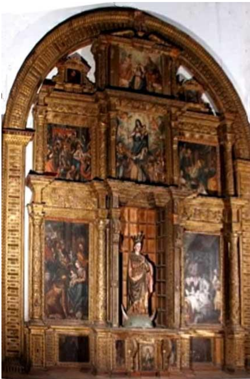
Ilustración 5: Retablo de Nuestra Señora del Rosario de los españoles, en el Templo de San Juan del Obispo (Sacatepéquez). La imagen de bulto de la Inmaculada Concepción no pertenece al retablo original.

como garantía, entre otros bienes, unas casas principales, la Hacienda Nuestra Señora de Aránzaru en Zacatecoluca con un obraje añilero, la estancia de ganado mayor Nuestra Señora de