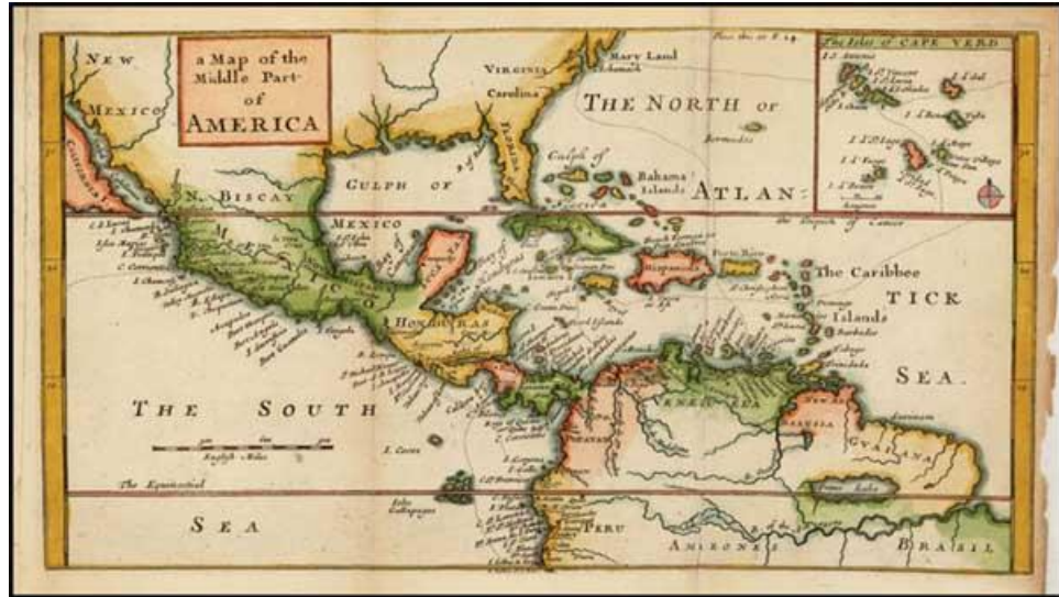
Ilustración 8: Mapa del Mar Caribe, que aparece en el libro A New Voyage Round the World , del pirata inglés William Dampier (1697).