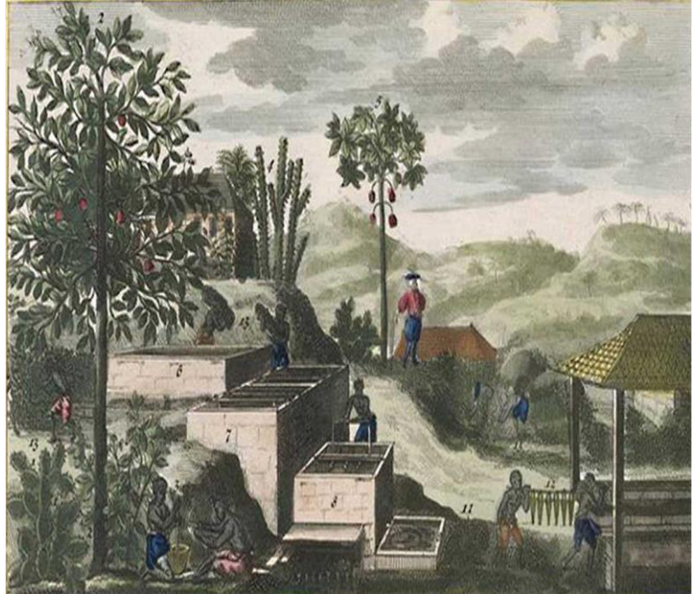
Ilustración 2: Obraje añilero hacia 1667. Pintura de Sébastien Leclerc que se encuentra en el Museo de Historia Natural, en París (Francia).

Este bagazo lo cargan los pileros a cuestras hasta echarlo en el río, estando para este efecto unos dentro de las pilas para sacarlo, y otros fuera para cargarlo. De manera que, todos los