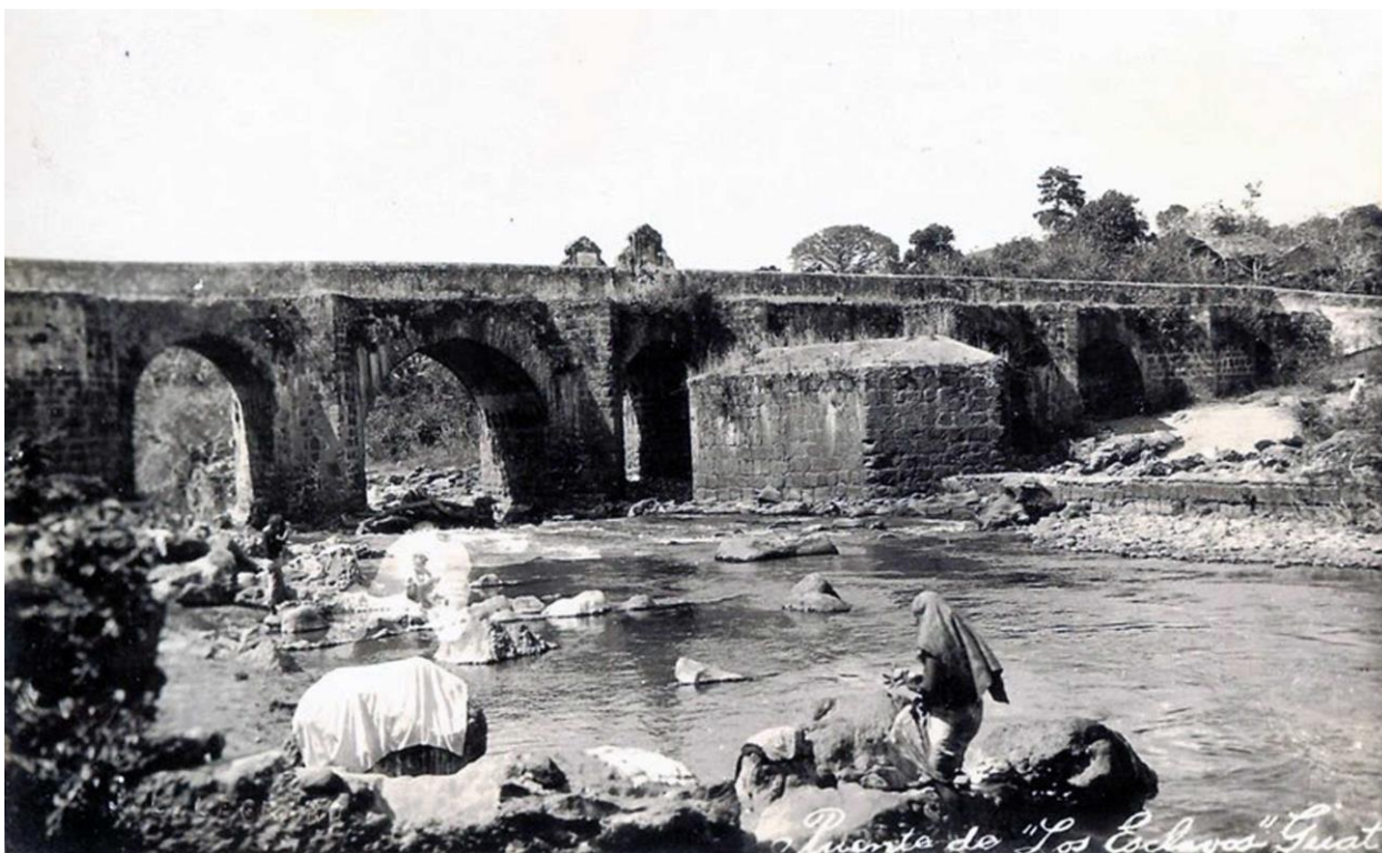
Ilustración 11: Puente de los Esclavos.