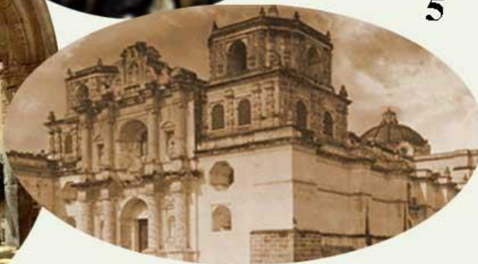
Ilustración 10: 1- Fuente de las Delicias. 2- Novicia del Convento de la Concepción, antes de realizar su profesión religiosa. 3- Fuente de la Gomera. 4- Templo de San Francisco El Grande. 5- Templo de Nuestra Señoras de las Mercedes.