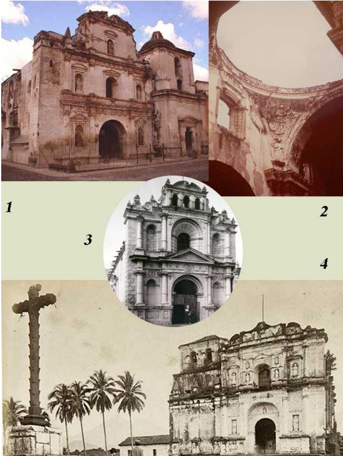
Ilustración 12: Obras del arquitecto Juan Pasqual: 1- San Agustín. 2- Arco Toral de la Catedral. 3- Iglesia de San Pedro. 4- Iglesia de Escuintla.