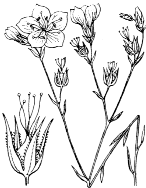
Linum tenuifolium s.s.