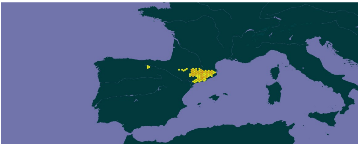
Linum tenuifolium subsp. milletii al món, segons GBIF