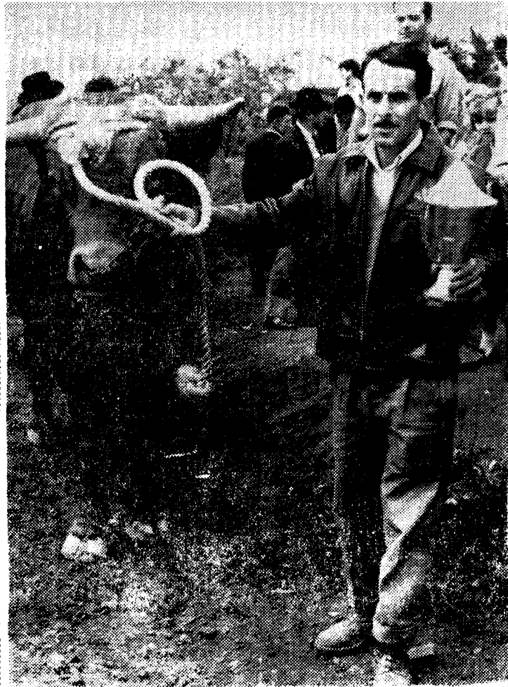
Montaña Alta de Guía. Feria de Ganado.