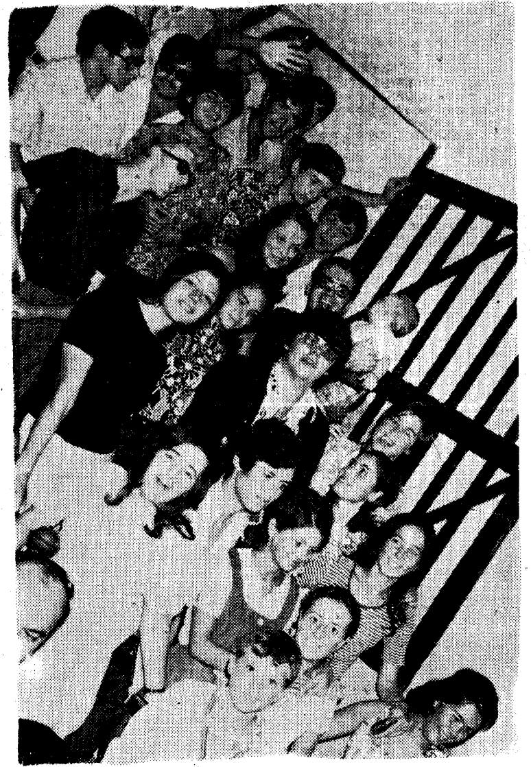
Grupo de jóvenes de Guía

Desde hace un tiempo a esta parte hemos mencionado en varias ocasiones la labor que este grupo de jóvenes de nuestra ciudad han venido desarrollando para que esta juventud que en gran número tenemos no se au-