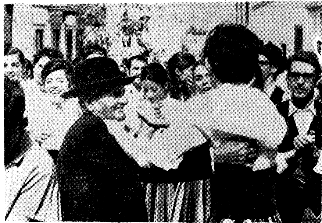
El gran ausente "Santito", no estará presente, pero si en la memoria de todos.