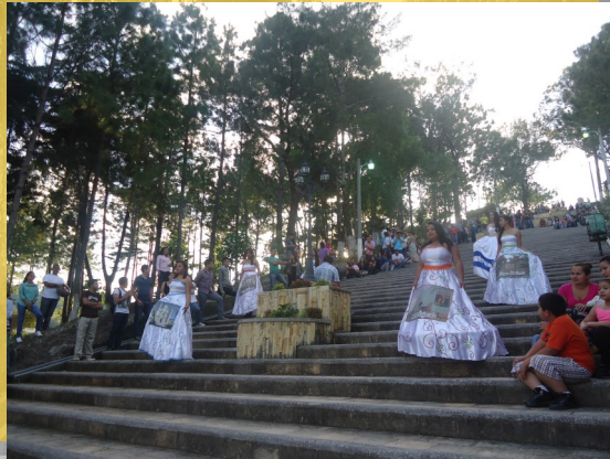
Estudiantes del Instituto "El buen Samaritano" modelaron diseños representativos del casco histórico.