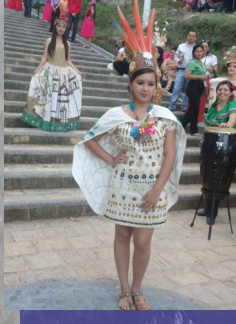
Trajes del cuadro de danzas "Popol Vuh", donados por Visión Mundial Honduras y muestra de vestuario lenca.