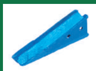
PUNTA SOCA DOS HUECOS REF: PSO-AZUL-4