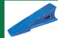
PUNTA SUBSOLADOR REF:PSB-AZUL-3