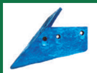
PUNTA ZANJADORA REF: PZ-AZUL-1