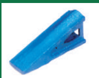
PUNTA SOCA REF: PSO-AZUL-1