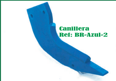
CENTANDEM CORTO REF: BR- AZUL 1