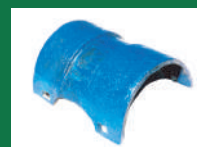
PROTECTOR CHUMACERA TATU REF: TCT-AZUL-1