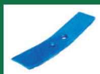
PUNTA BONFOR REF: PB-AZUL-1