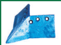
PUNTA SURCADORA REF: PS-AZUL-1