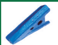
PUNTA SUBSOLADOR REF: PSB-AZUL-1