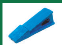
PUNTA SOCA REF: PSO-AZUL-6