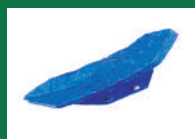
PUNTA SOCA REF: PSO-AZUL-1