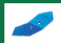
PUNTA TAPADORA REF: PT-AZUL-1