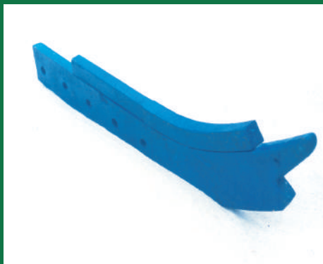
BRAZO ABONADOR REF: BR-AZUL-4