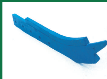
BRAZO ABONADOR REF: BR-AZUL-4