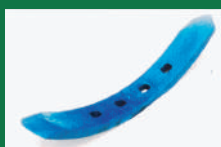
PUNTA ARADO TATU REF: PAT-AZUL-1