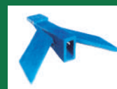
Punta deflectora Ref: PDE-Azul-6