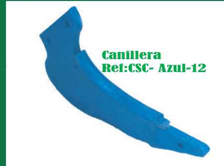
Canillera Ref:CSC- Azul-12