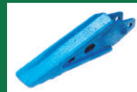
PUNTA SUBSOLADOR CON OREJA REF: PSB-AZUL-2