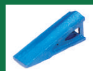
PUNTA ESCARDILLO PLANO REF: PES-AZUL-2