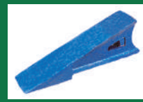
PUNTA SUBSOLADOR REF: PSB-AZUL-3