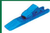
PUNTA ABONADORA REF: PAB-AZUL-1