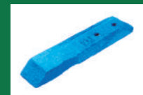
PUNTA ARADO CINCEL REF: PAC-AZUL-1