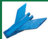
Punta deflectora Grande Ref: PDE-Azul-2