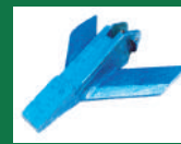
Punta deflectora Ref: PDE-Azul-4