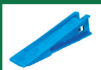
PUNTA SOCA REF: PSO-AZUL-3