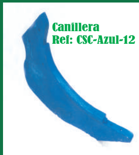
Canillera Ref: CSC-Azul-12