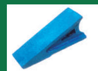
PUNTA SOCA REF: PSO-AZUL-5