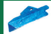
PUNTA ABONADORA REF: PAB-AZUL-2