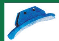
PUNTA ESCARDILLO REF: PES-AZUL-1