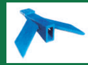
Punta deflectora Ref: PDE-Azul-6