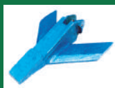
Punta deflectora minitandem Ref: PDE-Azul-4