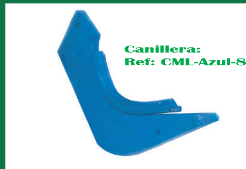
MINITANDEM LARGO REF: BRA-AZUL-5