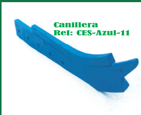
Canillera Ref: CES-Azul-11