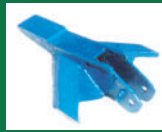
Punta deflectora Ref: PDE-Azul-3