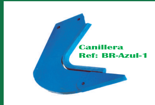
CENTANDEM LARGO REF: BR-AZUL-2