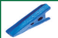
PUNTA SUBSOLADOR REF: PSB-AZUL1