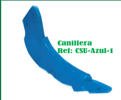
Canillera Ref: CSU-Azul-1