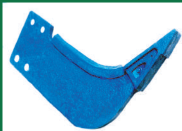
BRAZO SUBSOLADOR RECTO REF: BRS-AZUL-3