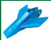
Punta deflectora Ref: PDE-Azul-1