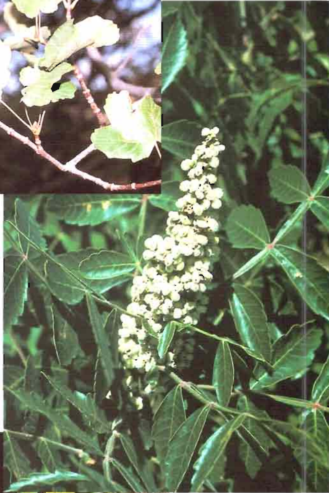
5. Rhus coriaria L.