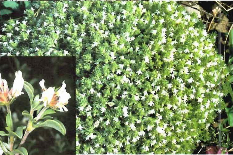
40. Thymus sabulicola Coss.