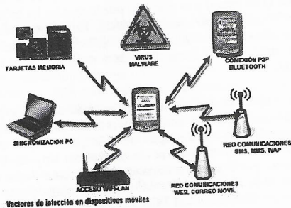
Figura 1: Vías de infección en dispositivos móviles

USB: La mayoría de terminales del mercado traen consigo un puerto USB mediante el cual pueden conectarse a un PC. Es muy común su uso a la hora de sincronizar las agendas de ambos dispositivos y puede ser justo en este momento cuando una infección puede trasladarse de un dispositivo a otro.