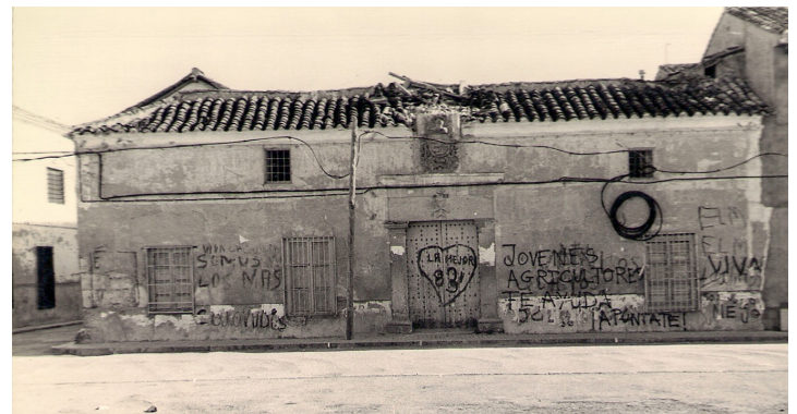
Antigua casa señorial en la Plaza Cervantes, con su escudo, ya desaparecida. ¿La recuerdas?