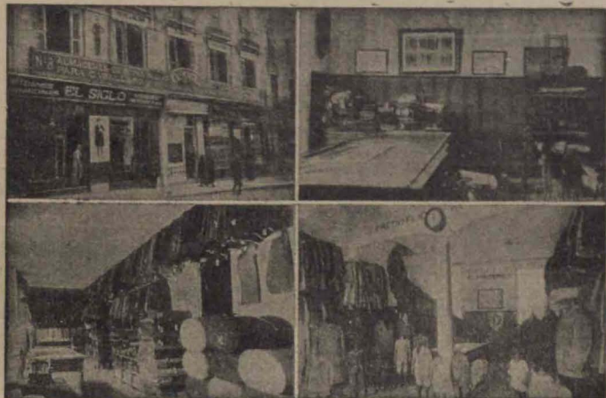
Cuatro vistas parciales de la Casa Matriz en Granada calle de Reyes Católicos

Americanas Sport - Pantalones Tenis - Gabardinas Trajes de confeccion esmeradísima Precios Fijos y económicos, como ninguna otra casa Ventas al contado :-: Siempre nuevos modelos