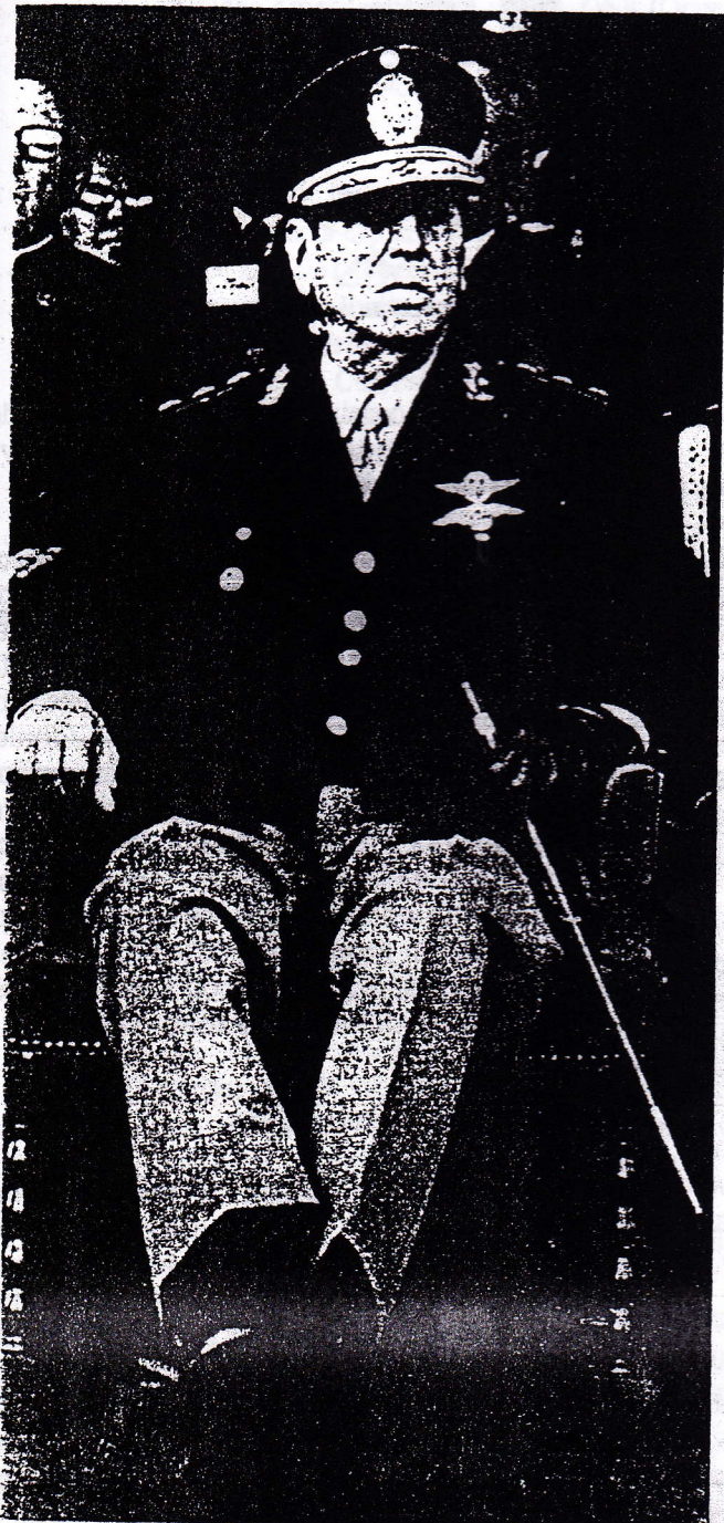
El general Juan Domingo Peron, varias veces gobernante en Argentina.

Estos movimientos presentaron a sus gobiernos como especies de "árbitros" por encima de las clases y sus contradicciones, para lo cual centralizaron el poder de Estado en un ejecutivo muy fuerte. Se enfrentaron con frecuencia a los sectores tradicionales oligárquicos, terratenientes, comerciantes, importadores, en beneficio de la burguesía industrial. Para ello debieron apoyarse en ocasiones en el movimiento popular y hacer concesiones en política social a la población trabajadora.