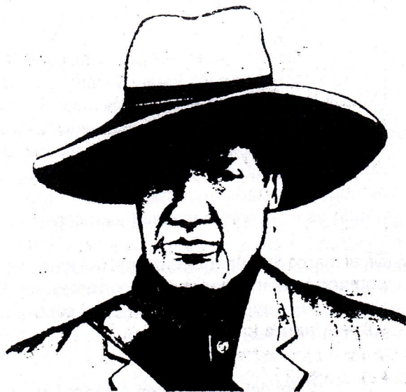
Augusto César Sandino.

Sandino había hecho saber muchas veces que estaría listo para negociar la paz a partir de la salida de los marines . El 1° de enero de 1933, el último contingente de marina de Estados Unidos embarca en el puerto de Corinto. El presidente Sacasa organizó inmediatamente una comisión para entrevistar a Sandino, y