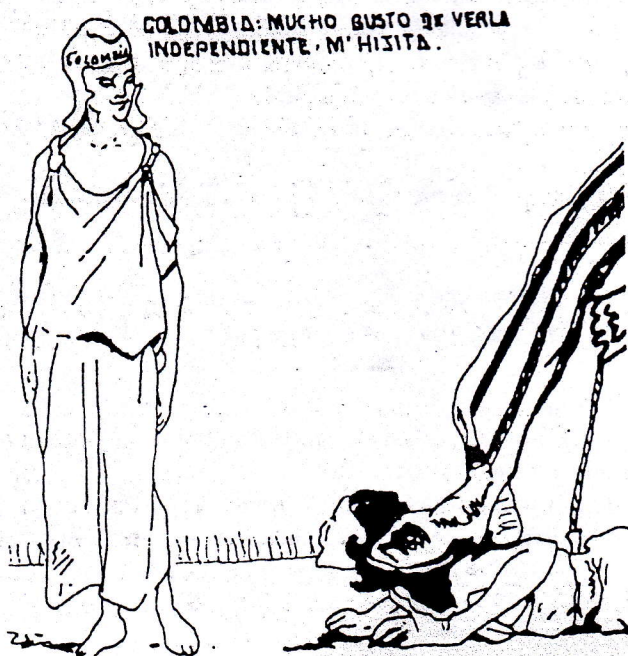
Caricatura de Rendon sobre la pérdida de Panamá.

En conclusión, el interés fundamental de EE.UU. en Nicaragua y Panamá es más estratégico en términos políticos y militares, que directamente financiero.