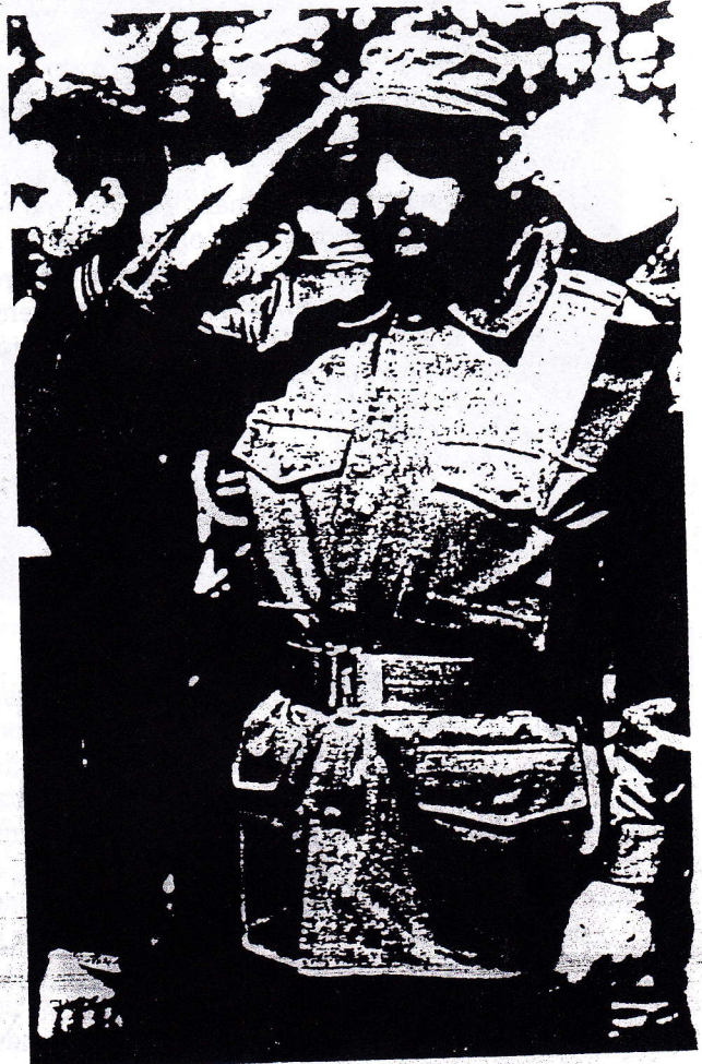
Fidel Castro Ruz.

Con las cargas así definidas, el presidente Kennedy, siguiendo los planes del gobierno anterior, ordenó a la