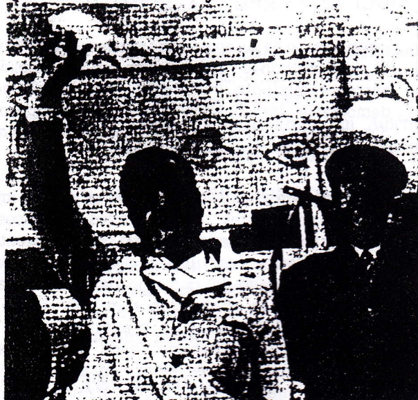
Salvador Allende y el poeta Pablo Neruda a su izquierda.