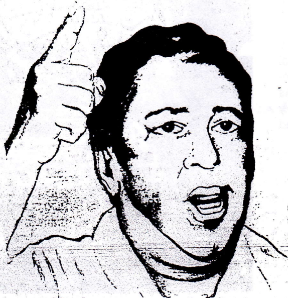
Pedro Joaquín Chamorro.

principal oposición en aquel entonces provino de un movimiento organizado y liderado por César Augusto Sandino, quien murió asesinado. De 1937 a 1979, el poder político y económico estuvo en manos de la familia Somoza, que gobernó con el único motivo de acrecentar su poderío. En 1963 murió Luis Somoza Debayle, quedando su hermano Anastasio como dueño absoluto del poder. Bajo el mandato de éste la corrupción alcanzó niveles escandalosos y fueron desconocidos los más elementales derechos democráticos. Fue una dictadura basada en la represión, que siempre contó con el apoyo incondicional de EE.UU.