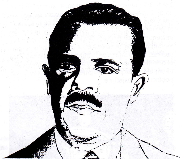
Getulio Vargas en Brasil y Lázaro Cárdenas en México, dos de las más destacadas figuras del populismo de los años 30 y 40.