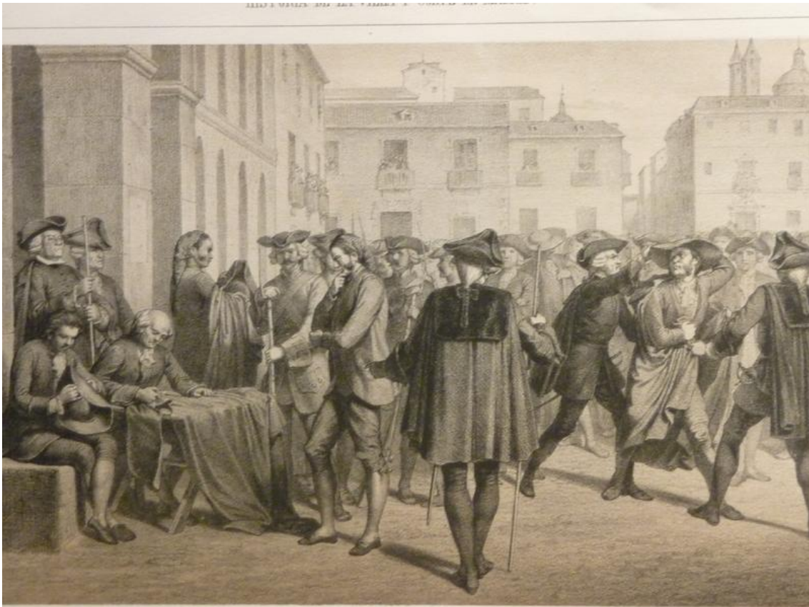
Grabado sobre El motín de Esquilache de 1766