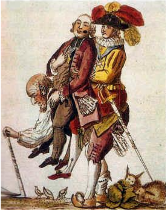
Grabado anónimo coloreado (Biblioteca Nacional de Francia.París)