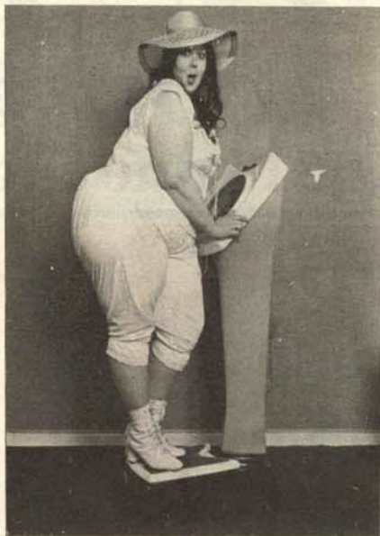
Miss Abundancia pesándose la nalga que ha prometido regalar a los pobres de solemnidad el día de la llegada de la inflación.