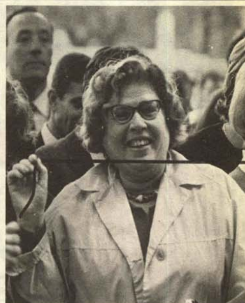
Señora comprobando jubilosamente la actual tensión inflacionista.