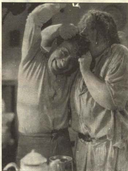
Matrimonio hasta ahora bien avenido ensayando una futura escena conyugal posinflacionista.