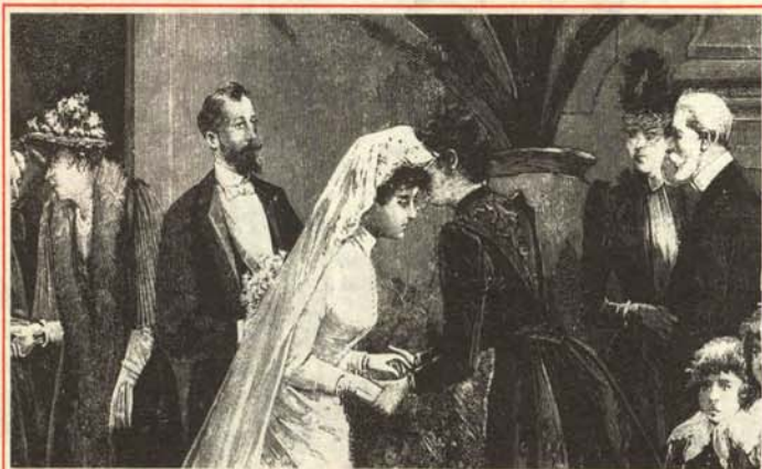
—Si te sale de mala calidad, denúncialo al INDIME.