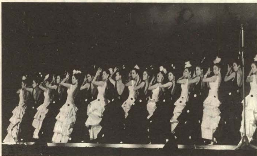
Bellas señoritas dispuestas a celebrar una simpática batalla de flores, hortalizas, verduras y legumbres.