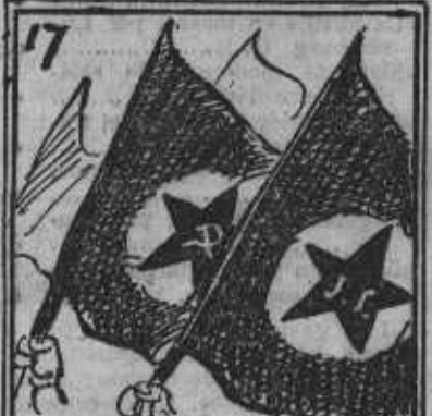
Todos a una sin cejar. Así siempre, hasta triunfar.