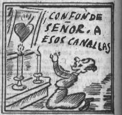
Las devotas, con ardor, velas ponen al señor.