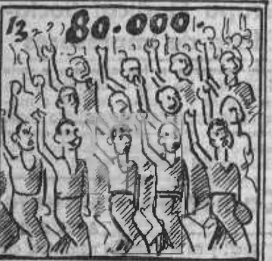
Para hacer cuenta redonda, doce más que en Covadonga.