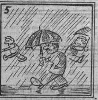
Pero un gran temor había de que se suspendiera.