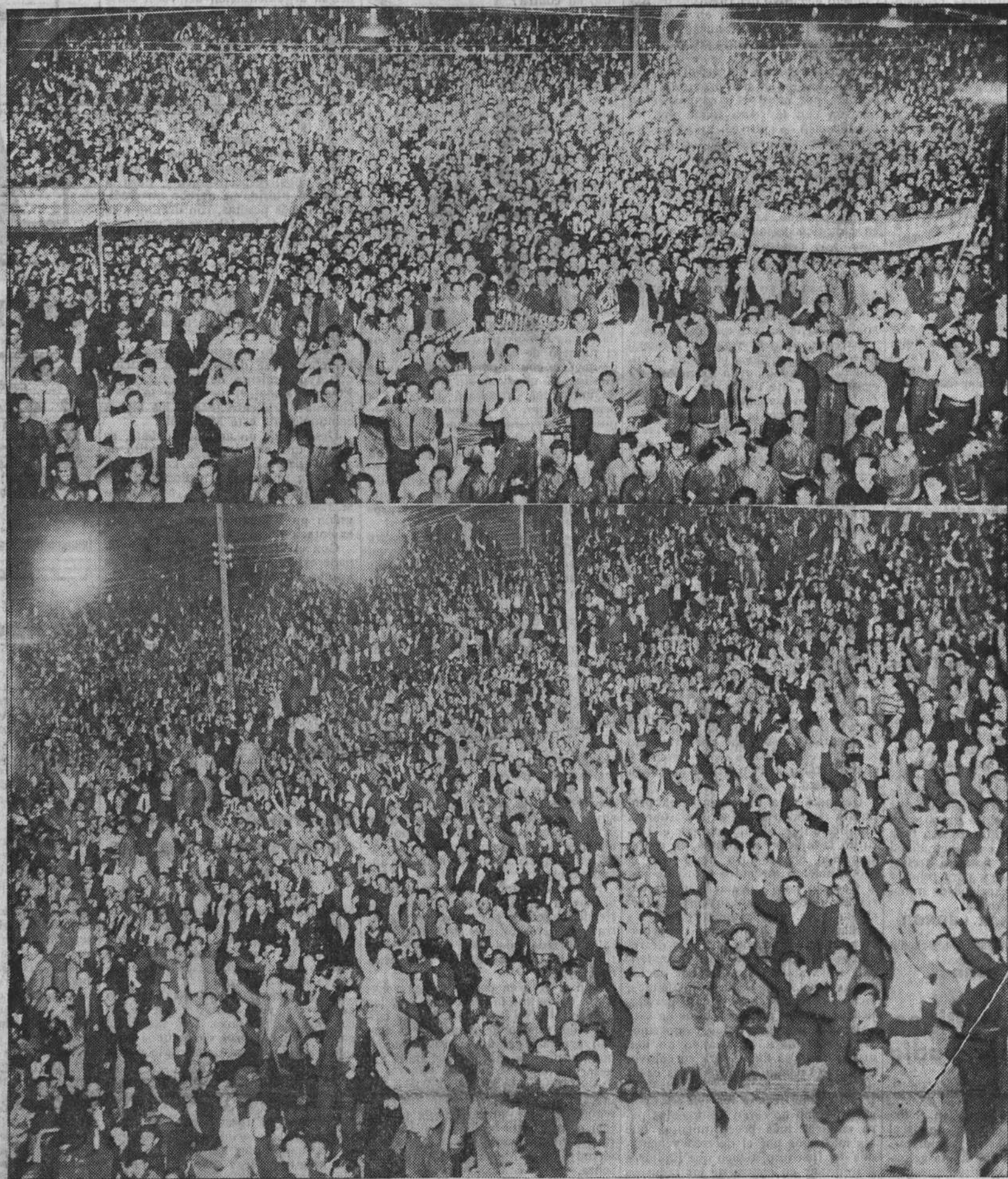
DEL MITIN DEL STÁDIUM. — Dos aspectos que permiten apreciar la importancia de la concentración proletaria

A fin de evitar que los agentes violenten los cajones y armarios que las organizaciones tengan en sus respectivas Secretarías, se recomienda a las Juntas directivas que los compañeros que posean las llaves acudan a la Casa mañana, lunes, para que se haga el registro y pueda normalizarse la vida de las entidades que tienen en ella su domicilio. — LA JUNTA ADMINISTRATIVA.