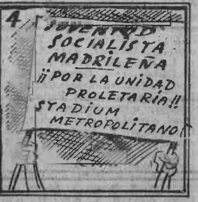
Acordaron protestar y un gran mitin celebrar.