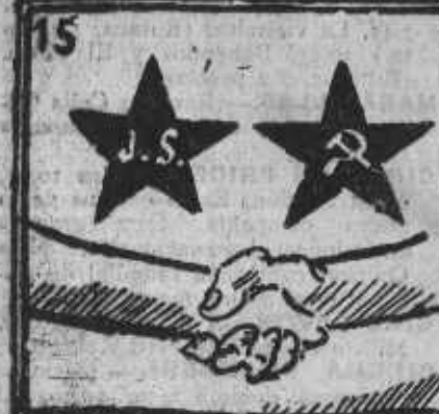
Quedó sellada la unión. ¡Viva la unión!