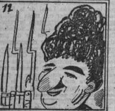
Si yo no echo mal la cuenta, pues fuimos... unos ochenta...