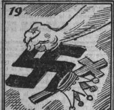
Hay que salvar la nación. ¡Abajo la reacción!