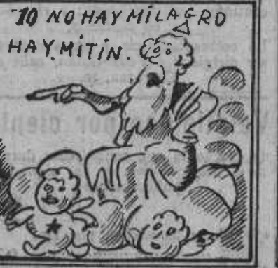
O yo estoy mal de la vista, o Dios se ha hecho socialista.