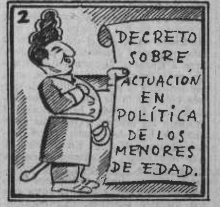
«La apuesta fué porque un Salazar esto escribía. [día...]