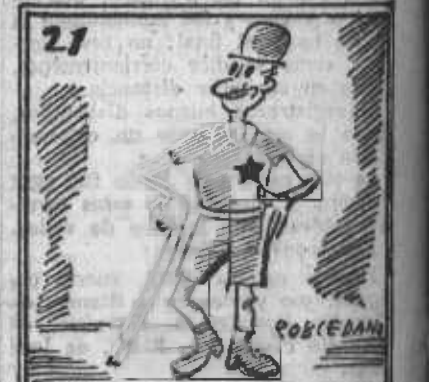
¿Tienes algo que cojetar a esto, inmenso Salazar?