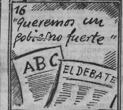
¿Gobierno fuerte queréis? Gobierno fuerte tendréis.