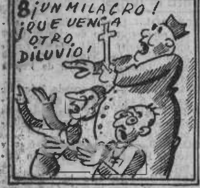
Rogativas y oraciones hacen los de los colchones.