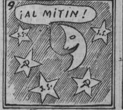
Mas al final no llovió y el mitin se celebró.