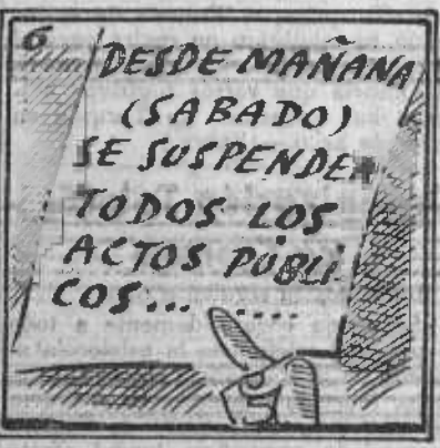
Todo estaba calculado: si llueve, acto fracasado.