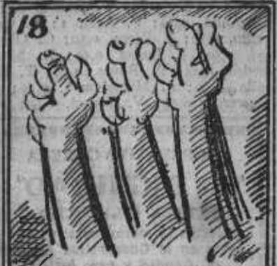
Siempre ¡adelante, adelante!, sin desmayar un instante.