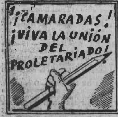
En fin, hay que trabajar. ¡Camaradas: A empezar!