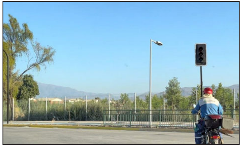
Semáforos se encontraban apagados desde el sábado.

«Hoy usan la caletería los vecinos que viven en el sector, las personas siguen derecho para tomar la nueva ruta 60 CH, lo importante es que la gente entienda que la