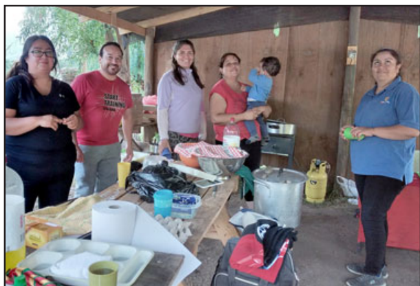
Los adultos, padres, apoderados y miembros de la organización, también fueron parte de la actividad.