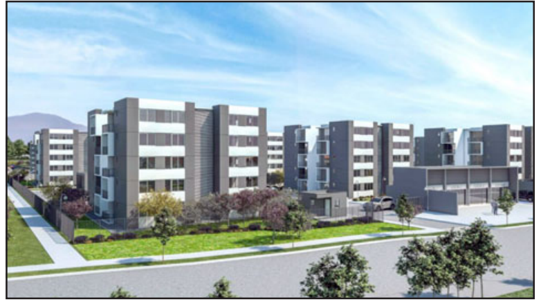
Acá una imagen de las torres del proyecto Porvenir II.

- Exactamente. No se pueden habitar, porque nos dicen que hicieron una renegociación, que están esperando que suelten los dineros los bancos, y excusas. La verdad, más que nada yo hice esto público porque queremos res-