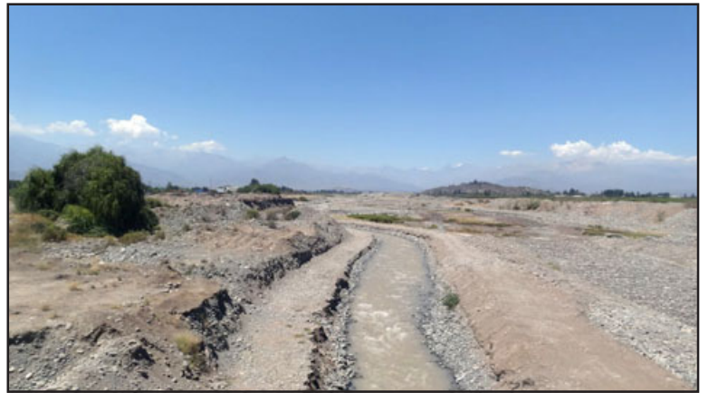
EL RÍO NO ALCANZA.- Nuevos pozos se suman a la extracción de agua debido a la sequía que se está viviendo.