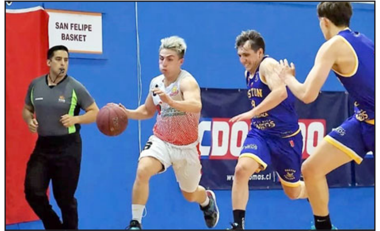
San Felipe Basket cumplió una campaña extraordinaria en el Campioni del Domani.