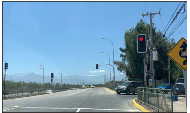
Los dispositivos fueron reparados y ya se encuentran nuevamente habilitados.

empresa se mantiene, no ha terminado el proyecto, se está trabajando en las observaciones que ha realizado Serviu, para ver por ejemplo el tema de los árboles, las bajadas de vehículos. La empresa estará hasta marzo o abril para lo mismo»,