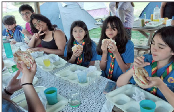
Un alto para reponer energías durante el campamento desarrollado al interior de Santa Rosa de Catemu.

terminar su Curso Adiestramiento III, por lo que fueron certificados y reconocidos por la Corporación Scouts Ashanti Chile, como Especialista en Tropa y Manada, respectivamente.