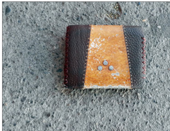
Billeteras como ésta, tirada en el suelo, han aparecido bastante en la Feria Diego de Almagro.