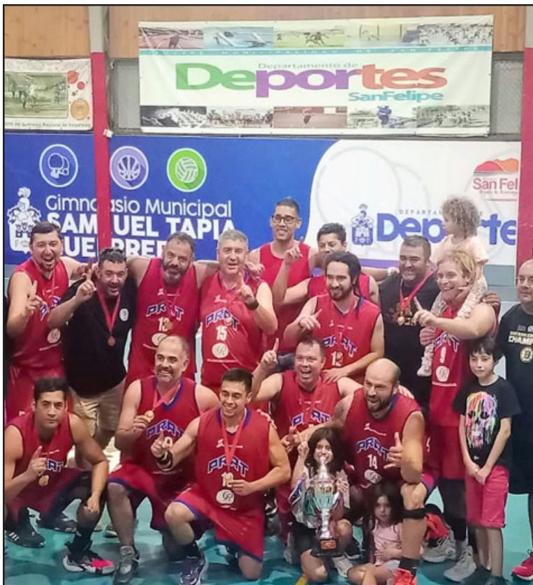
El Prat B ganó de manera invicta el torneo de Ascenso de la ABAR.