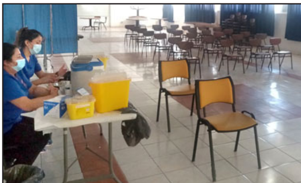
TOTALMENTE VACÍA.- Así lucía la sala de vacunación en el punto del 'Liceo de Hombres' este lunes.

Finalmente, explicó que la intención de la inoculación extramural, la cual se seguirá extendiendo en distintos puntos de la comuna. «Esta es una estrategia de acercar la vacunación a los lugares donde hay mayor concurrencia de gente, digamos feria, supermercados o actividades que hace la municipalidad los fines de semana, donde sabemos que va a haber un punto de mucha afluencia de gente, y así aprovechar la oportunidad de la vacunación, acercando la vacuna a los usuarios», concluyó la encargada del programa de inmunizaciones.