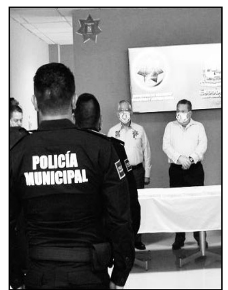
En total son 12 nuevos elementos

Tras haber concluido su enseñanza en la Academia de Policía, 12 cadetes recibieron su constancia que los acredita como elementos de la Secretaría de Seguridad Ciudadana y Justicia Cívica de Escobedo.