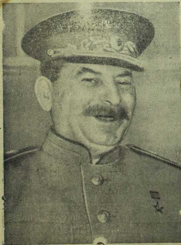
EL MARISCAL STALIN

Como proceder al arreglo, por parte de la sección de Vialidad correspondiente, puede ser un trabajo ya engorroso, el citado chacrero sugiere que se comenta a un arreglo rápido al camino de tropez que corre a su vera, lo cual permitiría a los camiones que así lo desearan transitar por este último camino citado.