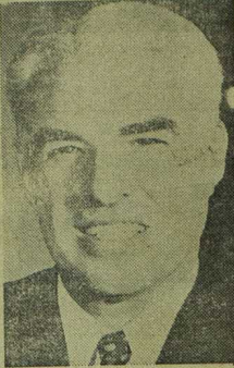
Edward R. Stettinius

"Atendiendo esa labor," añadió, "esos organismos están brindando una de las más importantes aportaciones que pueden hacerse ahora, hacia el establecimiento de un organismo internacional que y que dé buenos resultados, en el cual nuestro país tendrá participación activa que corresponda con su posición como potencia mundial."