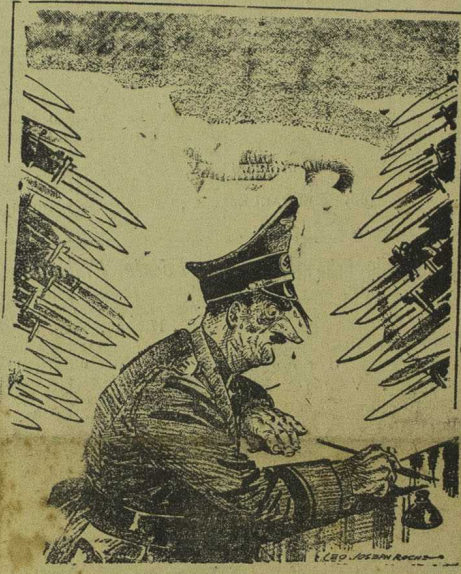
—HITLER HA MUERTO!— Diseño al Almirante Doenitz para sustituirme. Y firma: Adolfo Schickelguber Polci.

En la tarde de ayer se conoció la noticia que Radio Hamburgo había prometido al mundo como de carácter trascendental.