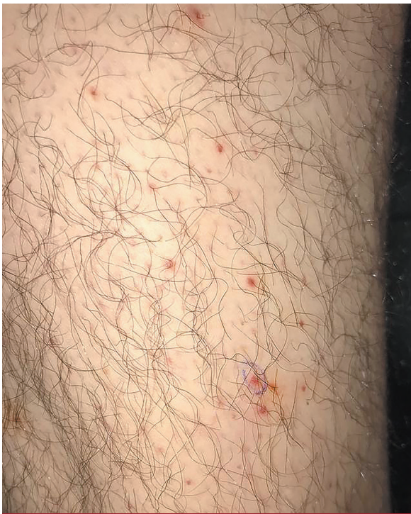
FOTO 1: Pápulas purpúricas foliculares en la cara posterior del muslo.

mótica en el muslo derecho, que identificó una unidad pilosebácea con dilatación infundibular, dermis con escaso infiltrado inflamatorio linfocitario perivascular, capilares dilatados y eritroextravasación focal (Foto 4). En conjunto con el Servicio de Nutrición, se inició tratamiento con ácido ascórbico 500 mg/día por vía oral y se reforzaron las medidas higiénico-dietéticas. El paciente evolucionó satisfactoriamente, con desaparición de los signos y síntomas al mes de iniciada la suplementación.