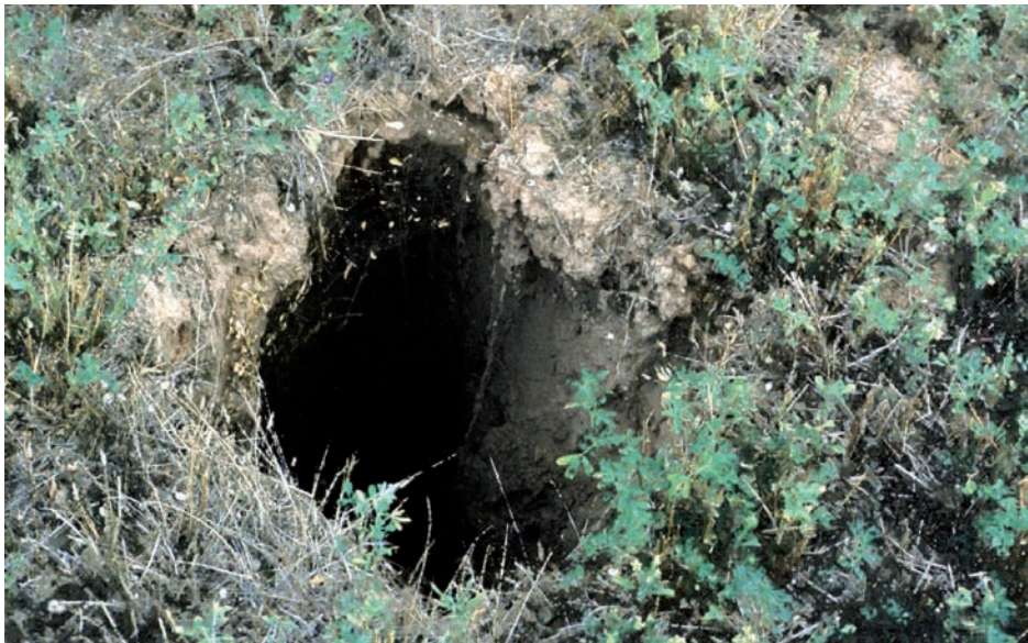
Foto 4. Pequeño conducto vertical (de unos 40 cm de diámetro) en un campo de regadío en Villamediana (La Rioja) con cultivo de alfalfa.