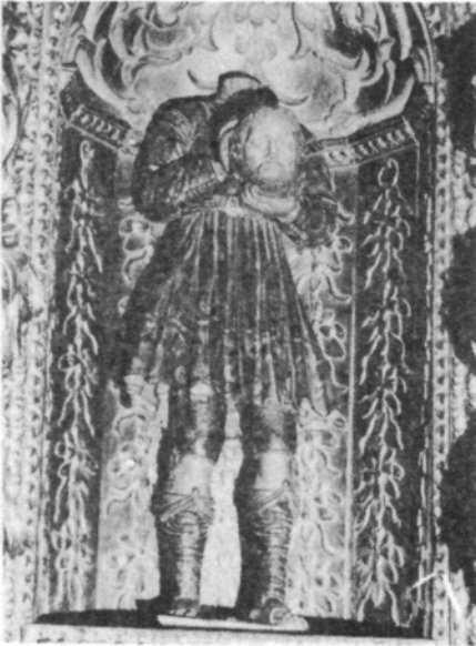
San Lamberto. Cuerpo central.