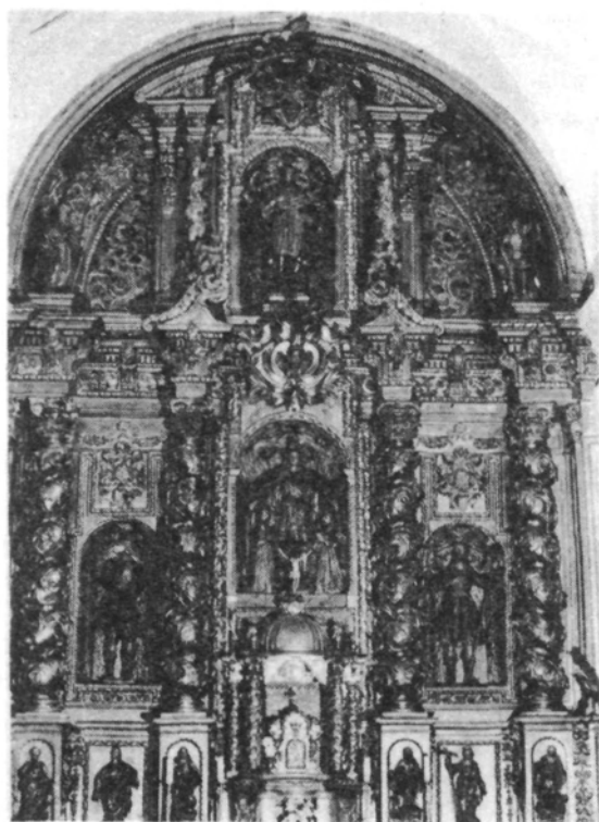
Retablo Mayor de la iglesia de Nuestra Señora de la Piedad de Ainzón. Conjunto.