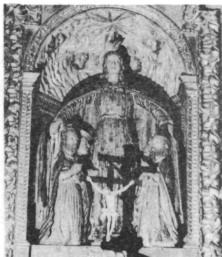
Nuestra Señora de la Piedad. Cuerpo central.