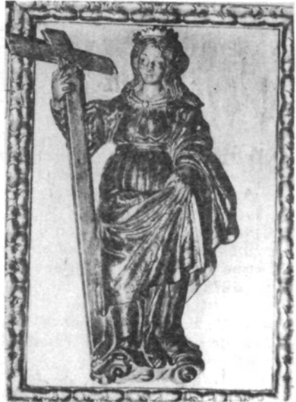
Santa Elena. Banco.