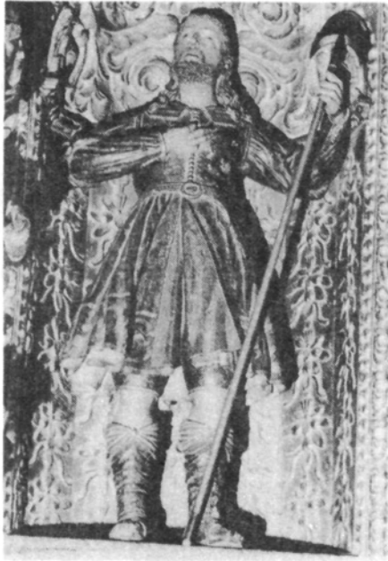
San Isidro. Cuerpo central.