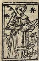
De sancto Titico diacon⁹ no. Capitulum. xcix. Titicus diacon⁹ discipulus sancti pauli apostoli et vnus ex vii. discipulis fuit: vt scri-

bit abbas dorothe⁹. H uius meminit idem aposto- lus in epl̄is suis: videlicet ad col. iij. et scda timo- iij. pronūcians eum fratrem charissimū ac confeso- rum suum in dño. Q ui etiaz ab eodem apostolo ebs colophonie ordinat⁹: post f̄dicatiōis officiiū diligēt⁹ peractū apud paphū oppidiū insule cypri quieuit in dño: ibidem sepultus. iij. kalen. maij.