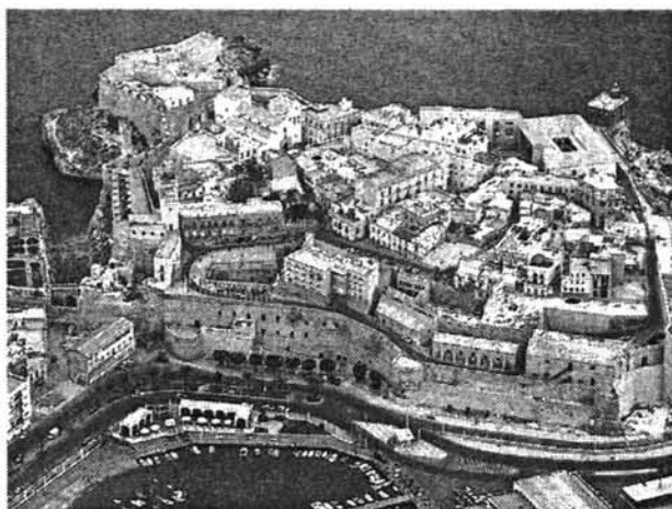
Lámina 2. Vista aérea de la fortaleza de Melilla. En primer término Torreón de la Cal, seguido de los cubos de Muñíz, y Camacha levantados por Sancho de Escalante.