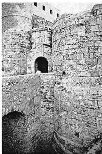
Lámina 3. Portada de acceso a la fortificación desde la ciudad vieja. Sobre el arco, escudo de Carlos V.