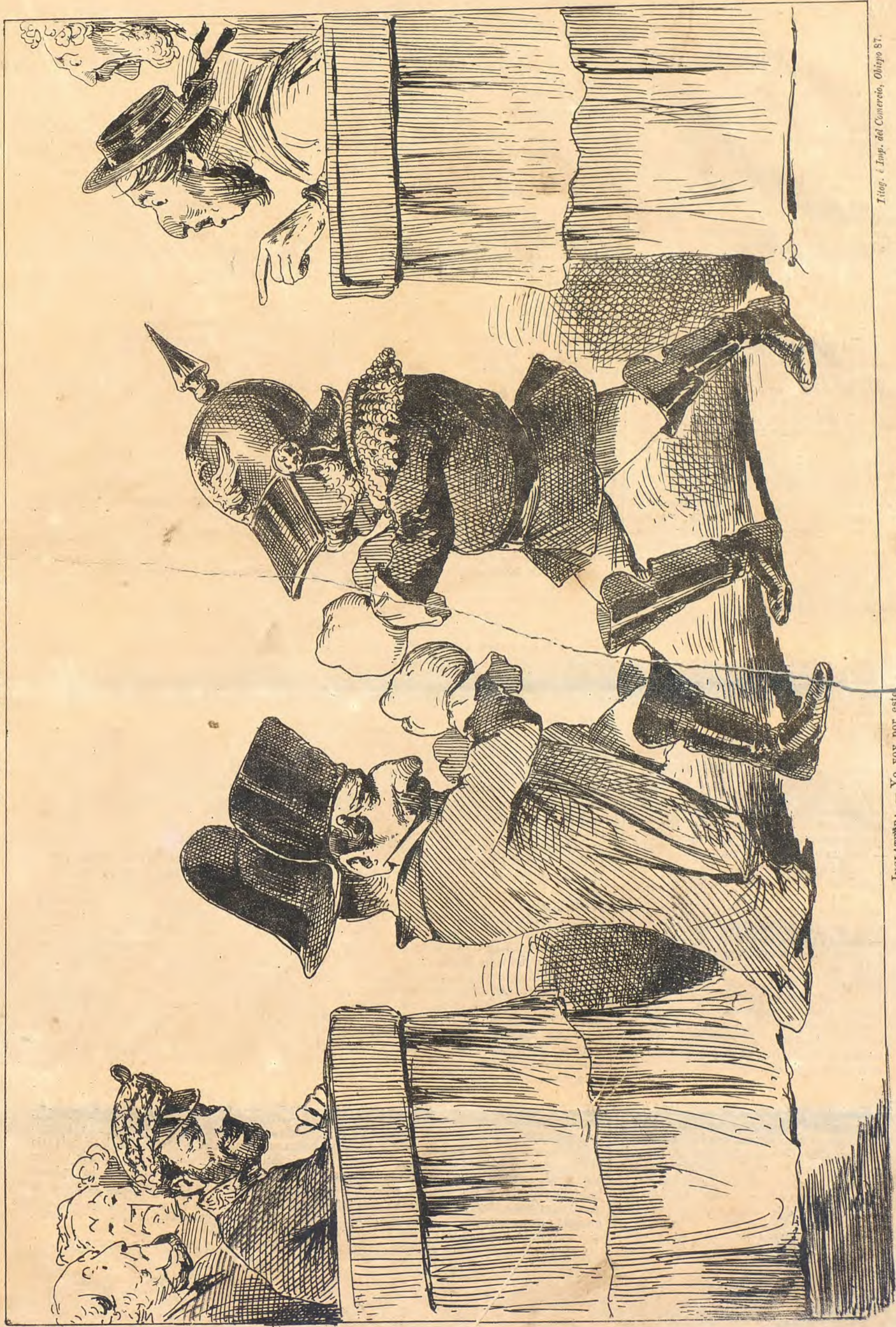
INGLATERRA. — Yo voy por este. DON JUAN. — Yo por ninguno. Voy á ver los toros desde la barrera.