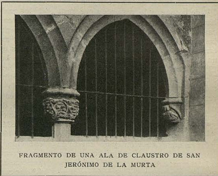
FRAGMENTO DE UNA ALA DE CLAUSTRO DE SAN JERÓNIMO DE LA MURTA

En 12 de julio de 1821 el Diario de Barcelona anunció la subasta de la casa nom-