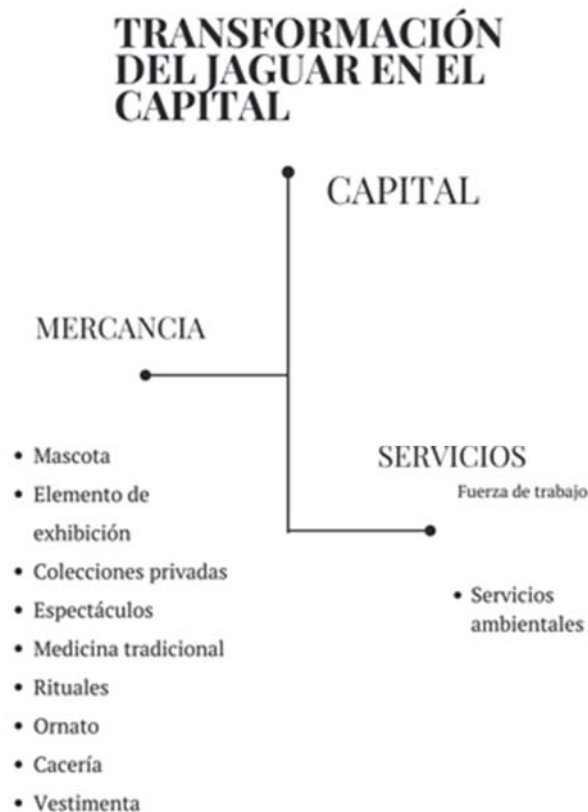
Figura 2. La cosificación del jaguar es dinámica, integral y no limitativa conforme al campo de dominación social donde interactúa.