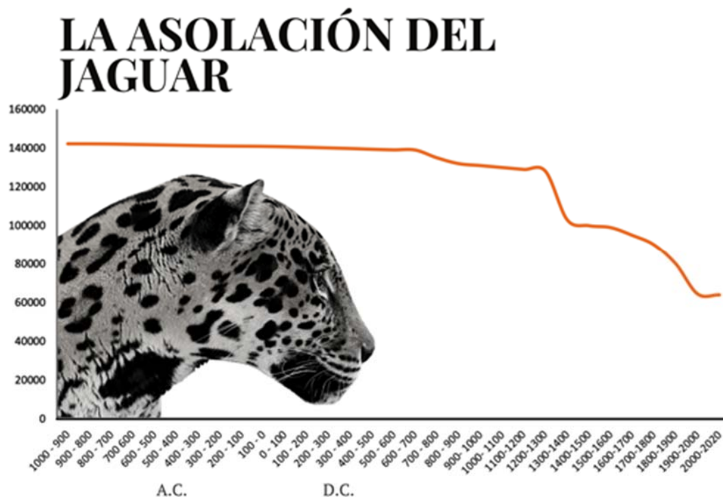
Figura 1. El decrecimiento del jaguar se asocia a factores civilizatorios de dominación. Los puntos exponenciales son la época prehispánica, colonial y la era del capital.

En la historia contemporánea comprendida en la era del imperio, la era del capital y el siglo XX, el asedio se potenciará a niveles críticos derivado del uso de pieles en la industria de la moda y la expansión de la ganadería rural: aproximadamente se extraían de la Amazonía brasileña hasta 15 000 jaguares y 80 000 ocelotes cada año a finales de la década de 1960 y 1970 33 . Las estimaciones de las importaciones anuales en los Estados Unidos y Europa en el período, indican que anualmente llegaban al mercado más de 15 000 pieles de jaguares y 200 000 ocelotes donde se incluían otras especie similares de menor tamaño, como el tigrillo o el jaguarundi 34 . En México 1 300 pieles de jaguar y 15 000 de ocelote y tigrillo, fueron exportadas legalmente a Estados Unidos de América entre 1968 y 1970 35 (Figura 1). Esta visión de aniquilación representa la cúspide del asedio del jaguar, si bien el capitalismo no es el culpable de la explotación de los animales no humanos, este sistema va a intensificar y a fortalecer la reducción de los animales y será parteaguas en la sexta extinción masiva de especies.