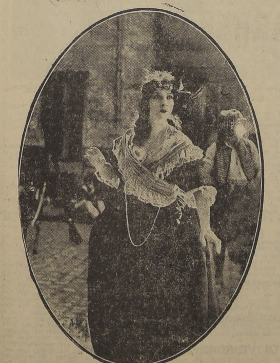
Esta película caracterizada con precisión los más brillantes episodios de la revolución francesa donde la Cortesana de Nantes, plebeya de origen, y casada con un noble, se vendió a diario de los desprecios recibidos por los amigos de su esposo, y donde una joven pareja, sin-