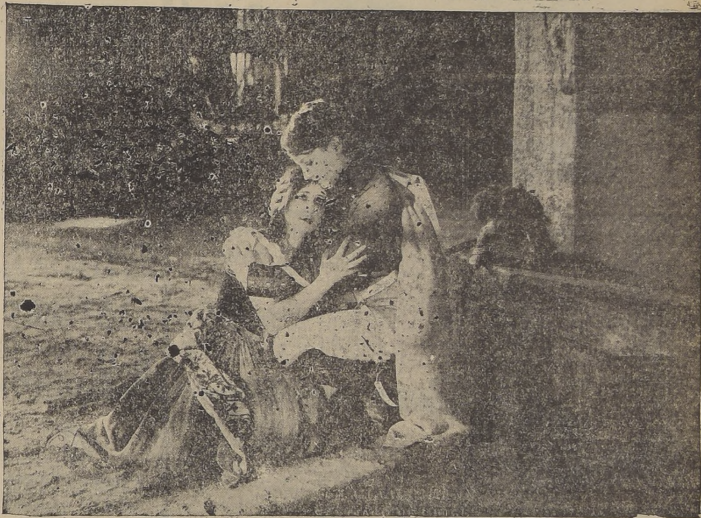
En efecto: Barrás, el miembro de la convención, en el momento en que Bonaparte va a abandonar, fracasado, pobre, Francia, la península comandada de aquellas tropas.