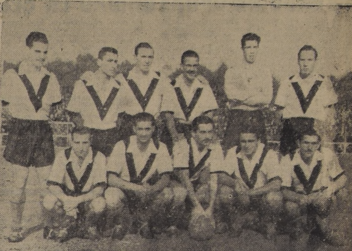
VOLVIO A GANAR.— Como en los partidos del año pasado, Santiago Morning volvió a vencer ayer a Colo Colo. Los recoletanos jugarán el match definitivo por el título con Audax Italiano, el domingo.