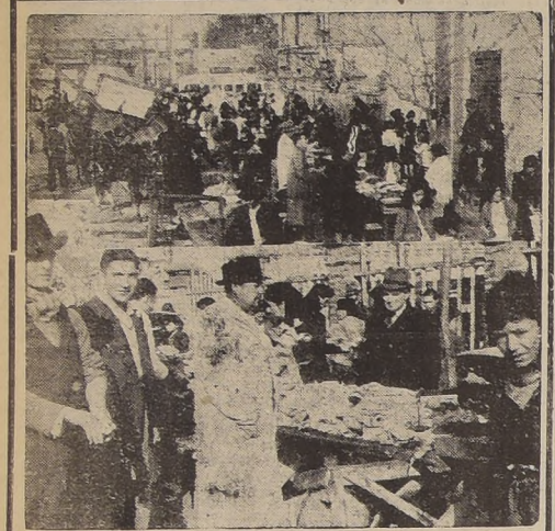
UNICO MEDIO DE ABARATAR LA VIDA. Compre Ud. en las FERIAS LIBRES

El Ministro del Interior declaró a mediados de ayer, después de una entrevista celebrada con S. E. el Presidente de la República, que en la última semana de sesiones correspondientes al presente mes del Congreso Nacional, será enviado el proyecto de ley por el cual se propondrá la solución integral del problema de la movilización colectiva en todo el país, y en particular, en las ciudades de Santiago, Valparaíso y Concepción. Aun cuando mantuvo reserva sobre la forma en que se propondrá esta solución, se tiene entendido que el Fisco adquirirá en Santiago la Compañía de Tranvías.