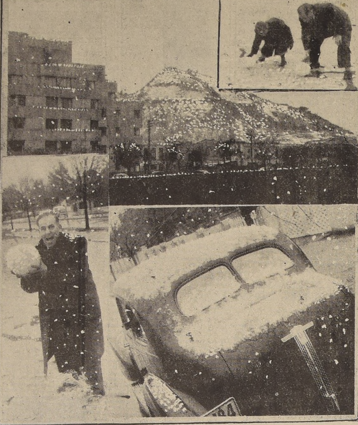
El presente mosaico muestra la intensidad que alcanzó la nevada de ayer en esta capital

BOLETIN DE OBSERVATORIO DEL SALTO Los meteorogramas recibidos en las últimas 24 horas, en el observatorio del Salto por telégrafo y por radio, confirman que el período de mal tiempo anunciado para mediados de junio ha comenzado a desarrollarse en el país. Las lluvias que el día 12 de junio se habían iniciado en la Zona Sur, se extendieron en las últimas 24 horas, a toda la zona central, mientras en la Cordillera se desarrollaba un violento temporal de nieve con un frío de 10 grados bajo cero, registrado en el Observatorio Meteorológico de El Cristo Redentor. En el Observatorio del Salto se han realizado interesantes estudios sobre la nevazón, la cual fué anunciada por radio a todo el país antes de producirse. La causa del fenómeno reside en una lluvia de frente frío, o sea, en términos corrientes, que la depresión formada por aire