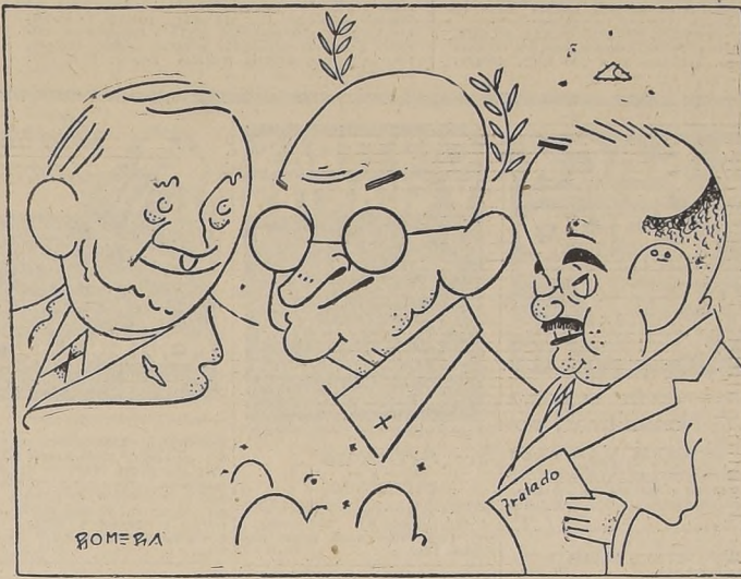
General H. H. Arnold, jefe de la Aviación de EE. UU.; general Miaja, ingresado en el ejército de México, y señor Molotov, quien ha firmado, en nombre de su país, el acuerdo anglo-ruso vistos por Romera.

Con ellos contuvo la ofensiva lanzada por los nazis en Kharkov. — Sigue resistiendo tenazmente la base de Sebastopol