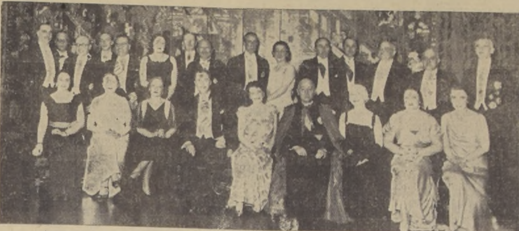
Asistentes a la comida ofrecida anoche por el Embajador del Brasil y señora, en honor del Canciller

Se le hizo entrega de la condecoración de la orden "Cruceiro do Sud"