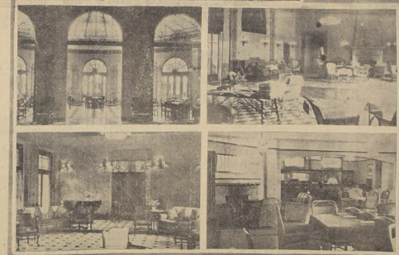
1. La magnífica entrada al Country Club de Lima. — 2. El Hall de la entrada, con una espléndida cúpula de "vitreaux". — 3. El Hall central. — 4. Otros de los salones del Club. — 5. La cantina y salón de fumar