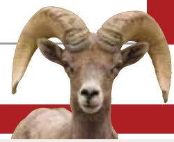
Carnero del desierto