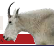
Cabra de las rocosas

Es difícil distinguir entre los machos y las hembras de la cabra de las rocosas. Tutorial de repaso y consejos, pág. 3.