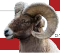
Carnero cimarrón