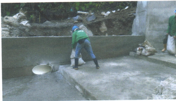
FOTO 6. CONSTRUCCION DE MURO PARA PROTECCION DE TUBERIA DE EXCESOS