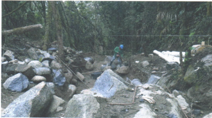
FOTO 30. PERFORACION DE ROCAS EN EL DESARENADOR