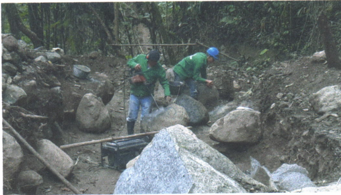
FOTO 29. PERFORACIÓN DE ROCAS EN ZONA DE DESARENADOR