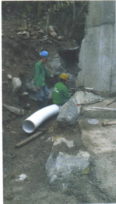
FOTO 5. INSTALACION DE TUBERIA DE EXCESOS