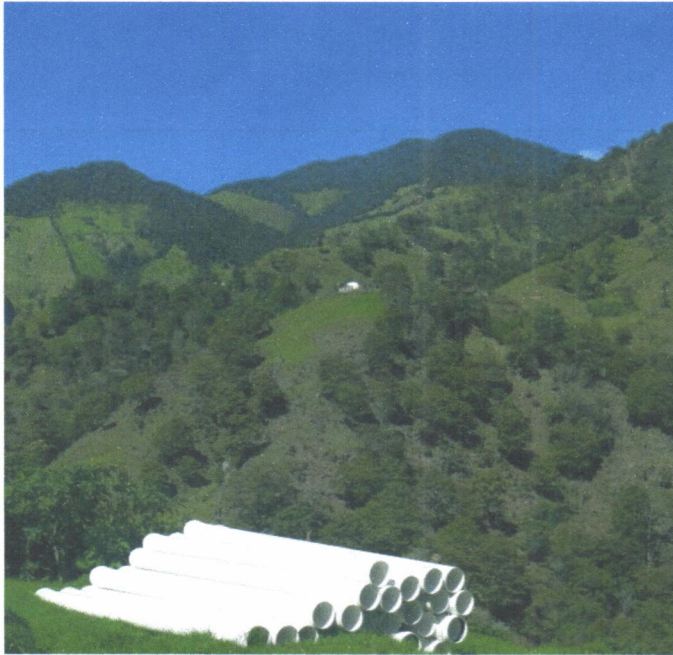
FOTO 3. TUBERIA DE 12 PULG EN P66