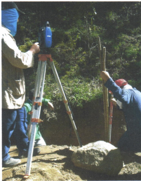
FOTO 10. CHEQUEO DE COTAS B1. 2182.45