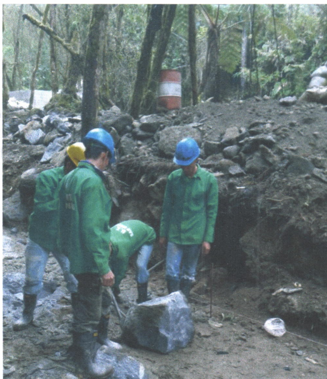
FOTO 26. RETIRO DE ROCAS EN DESARENADOR