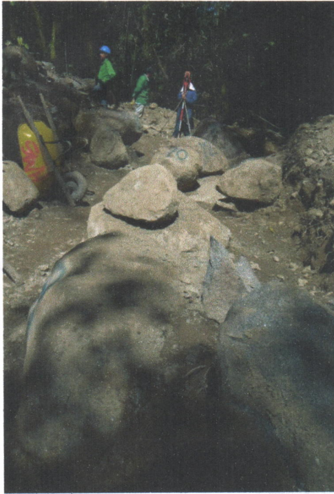
FOTO 17. MARCACIÓN DE COTAS, SALIDA DEL DESARENADOR