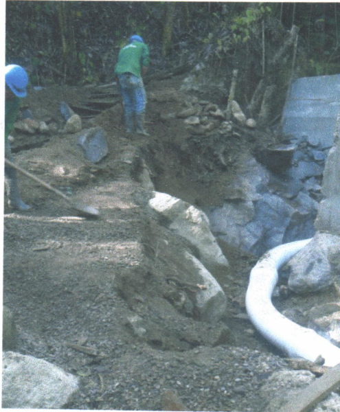
FOTO 7. RELLENO DE TUBERIA DE EXCESOS