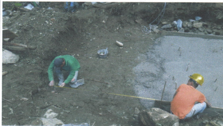
FOTO 22. INSTALACION DE CONCRETO DE NIVELACION EN EL DESARENADOR EN NUEVA UBICACION