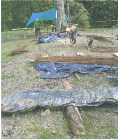
FOTO 9. FIGURADO DE ACERO PARA DESARENADOR