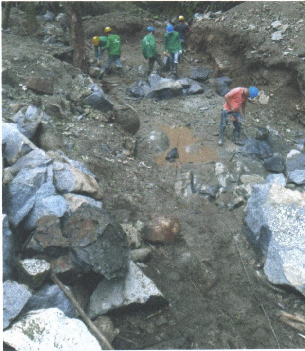
FOTO 28. ZONA DE DESARENADOR , RETIRO DE SOBRANTES Y DE MATERIAL