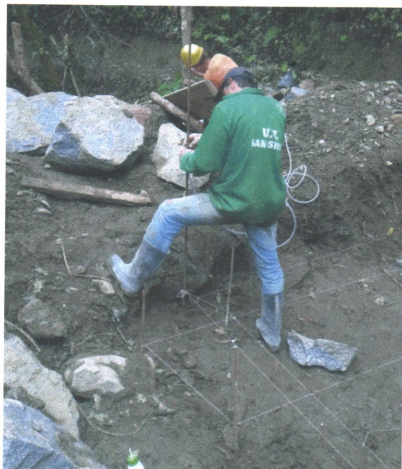
FOTO 23. REVISION DE COTAS EN DESARENADOR EN NUEVA UBICACION