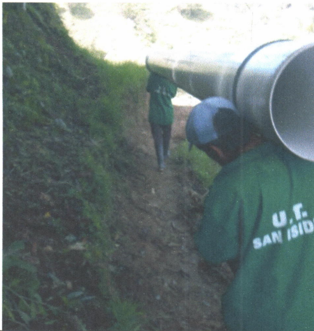
FOTO 4. TRANSPORTE DE TUB AL P66