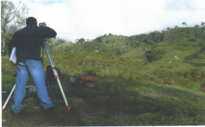
FOTO 18. CHEQUEO TOPOGRAFICO DE INTERVENTORIA