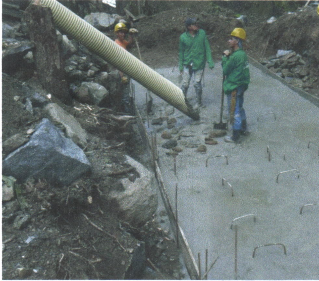
FOTO 24. INSTALACION DE CONCRETO PARA DESARENADOR EN NUEVA UBICACION