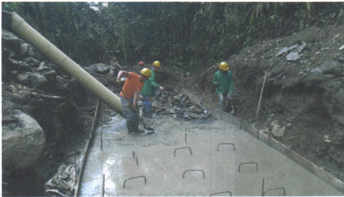
FOTO 25. INSTALACION DE CONCRETO DE NIVELACION EN DESARENADOR EN NUEVA UBICACION