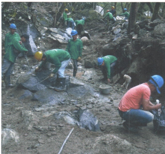
FOTO 27. RETIRO DE ROCAS EN ZONA DE DESARENADOR