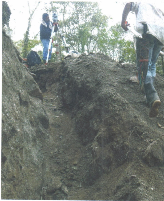
FOTO 19. REVISION TOPOGRAFICA A LA LINEA DE CONDUCCION