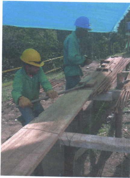
FOTO 8. FIGURADO DE ACERO