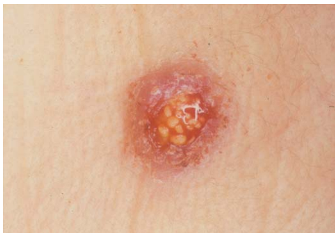
Fig. 3. Infección por Actinomyces a través de un absceso maseterino drenando a piel. Actinomyces infection from a masseter abscess opened to the skin.

Se iniciaron los primeros 15 días en la forma endovenosa a razón de 12 a 18 millones diarios en adultos (y dosis ajustadas por peso en los niños), seguida de tratamiento a largo plazo con amoxicilina oral a razón de 1.5 a 3 gramos diarios.