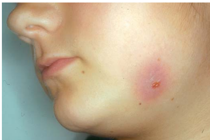
Fig. 1. Tumoración y fístula perimandibular Jaw swelling and fistula