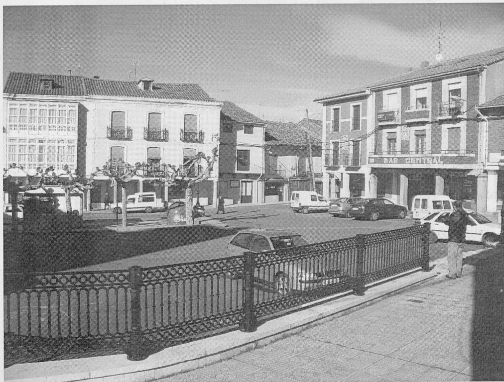
Plaza del Lino.

Desde los tiempos más remotos se traía a vender al mercado y puede apuntarse como circunstancia que acredita la importancia del cultivo del lino que, en el año 1628, el corregidor prohibió que se vendiera en las casas de los agricultores y ordenó que debía de llevarse al mercado. Al mismo tiempo, impuso los precios a que había de venderse para evitar fraudes, puesto que los usuales eran muy bajos, en perjuicio de la recaudación de las alcabalas. La disposición gubernativa no prosperó, ya que la Real Chancillería de Valladolid la revocó al recurrirla los lugares de la tierra solariega, unidos a los demás de la jurisdicción. Es significativo que uno de los argumentos esgrimidos por los recurrentes fue que "la villa no necesitaba del lino y en ella y en sus barrios se cogía más que en toda la tierra" , hasta el punto de que sus vecinos lo llevaban a vender fuera. (Pleitos civiles, Varela (F) c-2431-3).