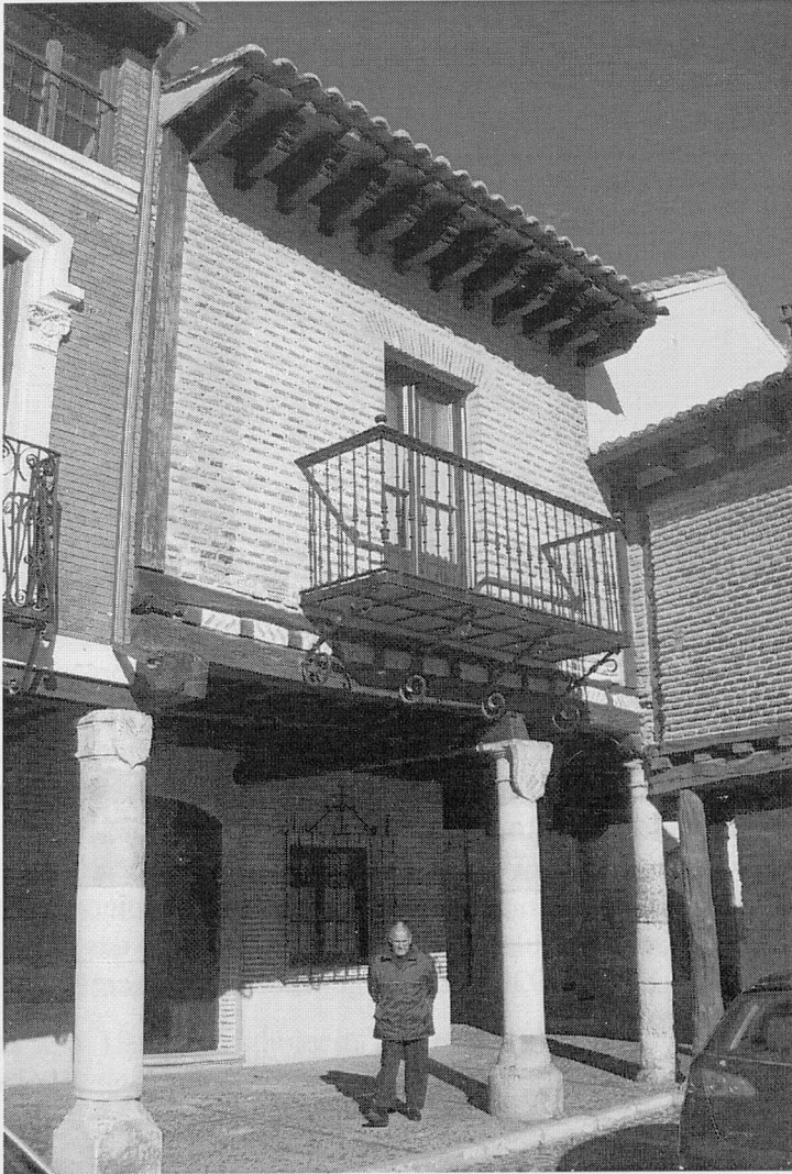
Casa que fue Ayuntamiento de Villa y Tierra, en la Plaza Vieja.

Actualmente, como es bien sabido, el nombre de plaza Vieja, es el comúnmente admitido y usado, por la fuerza de la costumbre, sin excepción, por los vecinos de Saldaña, su tierra y comarca.