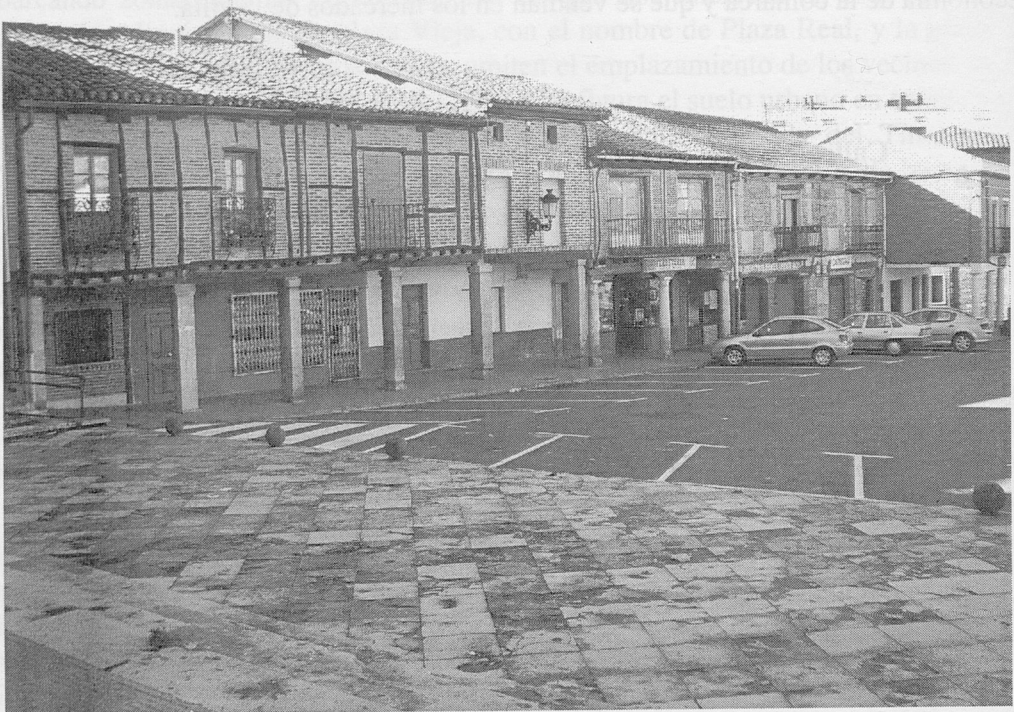
Plaza del Trigo.