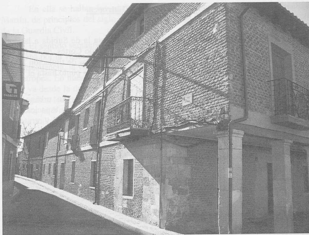
Calle del Tinte.

Dice Agapito y Revilla, en su obra "Las Calles de Valladolid" (edición facsímil. Valladolid 1982), hablando de la calle de los Tintes, que aparece en el plano de 1738 y que "el título debió dársele por los tintes que allí se hacían" , sin que aporte el autor ningún otro elemento en el corto comentario que dedica a esta calle. Al margen de cualquier otra consideración, puede valer este análisis para nuestra calle del Tinte.