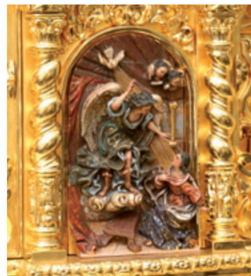
imagen que sale bajo palio en la procesión y la segunda, a la que veneran durante todo el año en este mismo altar las Madre Comendadoras, y que también se ha convertido desde hace algún tiempo en titular de la corporación.

Iglesia del Monasterio de la Madre de Dios de las Comendadoras de Santiago. C/ Comendadoras de Santiago, s/n.