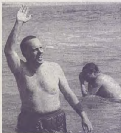
¡Que mellor cousa ca un baño para combate-lo alarmismo!

E en xeral, como dicía recentemente Tabucchi, unírnos a todos aqueles que senten repugnancia pola Información Indiferenciada , ese fenómeno que pon ó mesmo nivel a tortura de inocentes ca un partido de fútbol, ou que considera que ten máis mérito o Xacobeo Oficial ca unha festa tecida polo esforzo voluntario e solidario dunha comunidade veciñal deste país, o mesmo que cada primavera se renova en amarelo flor de toxo.