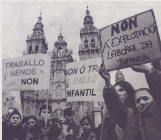
Instantánea da Global March ó Seu paso por Santiago, na que colaboraron unha mancha de ONGS galegas.

250 millóns de infancias roubadas ben merecen o noso esforzo.