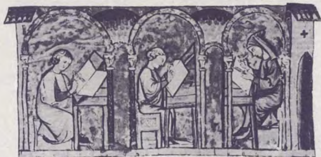
Miniatura do século XIII con homes escribindo