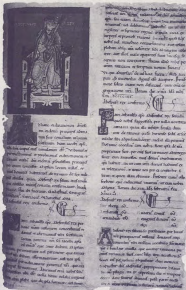
Páxina do Tumbo A. Catedral de Santiago de Compostela

Nas tres a protagonista é a moza namorada: na primeira pidelle á nai que a deixe falar co seu "amigo"; na segunda é el o que non acode á cita, e na terceira a doncela prégalle ó mozo que non a engane máis e que vaia á ermida onde ela o estará agardando. Escollémo-la última: