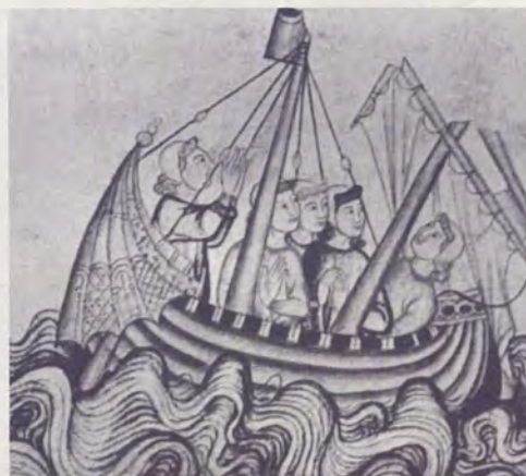
Naves medievais. Cantigas de Santa María

Non ei [i] barqueiro, nen remador, morrerei fremosa no alto mar: eu atendend'o meu amigo! Eu atendend'o meu amigo!.