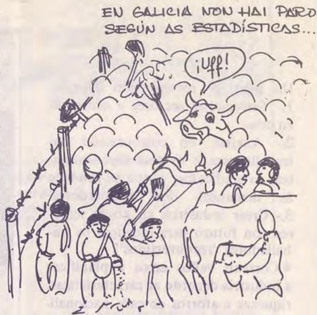
(FOTOGRAFIA TOMADA NUN LEIRO DA PARROQUIA DE BURRIFÓS)

Pero coa agudización da crise o problema do paro disparóuse tamén en Galicia. Só no ano 1983 o paro rexistrado -esto é os dos que se anotan nas oficinas de emprego, que como ben se sabe é menor que o real- aumentou en Galicia en 23.000 persoas, o que supón unha "velocidade de crecemento" dobre á de España. Nas comarcas de Vigo e Ferrol acadóuse unha tasa de 17 por cento. A fame empeza a premer nos barrios obreiros, a violencia nas rúas aumenta, moitos dos que forzados o engaiolados pola cidade venderan as súas terras quedan no máis puro abandono. Xa empezan a verse traballadores sen traballo remexendo nas barreduras de Teis, Coia ou Caranza.