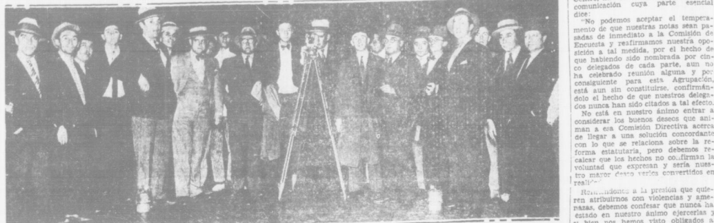
Asistentes a la inauguración de los trabajos de replanteo.