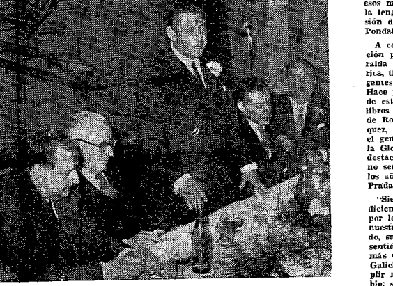
El Ministro del Interior Dr. Alfredo R. Vitolo, pronunciando un discurso.