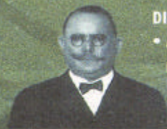
DICIEMBRE • Álvaro Obregón, presidente

COMO ÉSTE, EXISTEN otros corridos que Recuerdan la Revolución Mexicana. ¿ Qué Otros conoce usted? ; pregunte a sus compañeros qué corridos recuerdan y, si saben la tonada, invítelos a cantarlos.