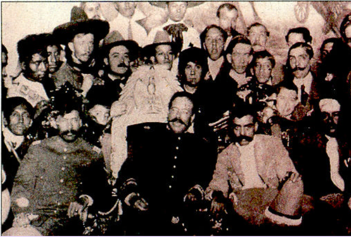
Francisco Villa, en la silla presidencial, el 6 de diciembre de 1914. Se ven sentados Tomás Urbina, Francisco Villa, Zapata y Otilio Montañó.

fugieron en Veracruz. Pero finalmente el talento militar de Obregón se impuso al de Villa y lo derrotó en la ciudad de Celaya, en abril de 1915.