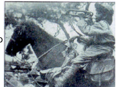
Niño soldado de la División del Norte.

acuerdo en que Carranza fuera el Primer Jefe , como se había hecho llamar, ni qué rumbo debería seguir la Revolución. En octubre de 1914, los caudillos o sus representantes se reunieron en Aguascalientes, para ponerse de acuerdo, en la Soberana Convención Revolucionaria.